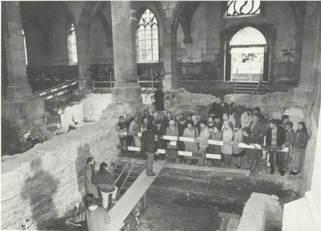
Abb. 5 Die Tage der offenen Tür führten am 7./8. November 1986 2100 Besucher in die St.-Johannskirche.