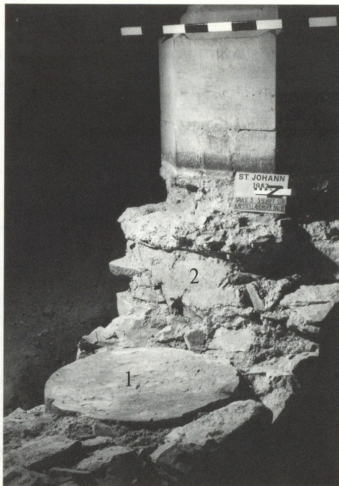
Abb. 3 Haupt der zweiten romanischen Säule von Westen (1). Im Mörtel darüber Abdruck des Kapitells (2), das bei der Anlage der äusseren Seitenschiffe 1515/17 entfernt wurde.