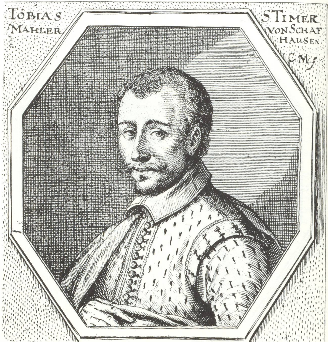
Tobias Stimmer Kupferstich von Konrad Meyer ohne Jahr

schen Beischriften, wechselnder Schreibweise und Schrift. Auch die Bildnisse selbst zeigen verschiedene Zustände der abgenützten und nachgestochenen Kupferplatten. Für Murer und Stimmer finden sich Fassungen mit C(onrad) M(eyer) f(ecit) , für Meyer selbst mit fecit hinter seinem Namen. Die kleineren Abzüge für Konrad Meyer tragen zum Teil die Jahrzahl 1675 oder 1676, auf den grossen (mit zwei Platten gedruckten) für Jos Murer und Konrad Meyer steht 1679. 31