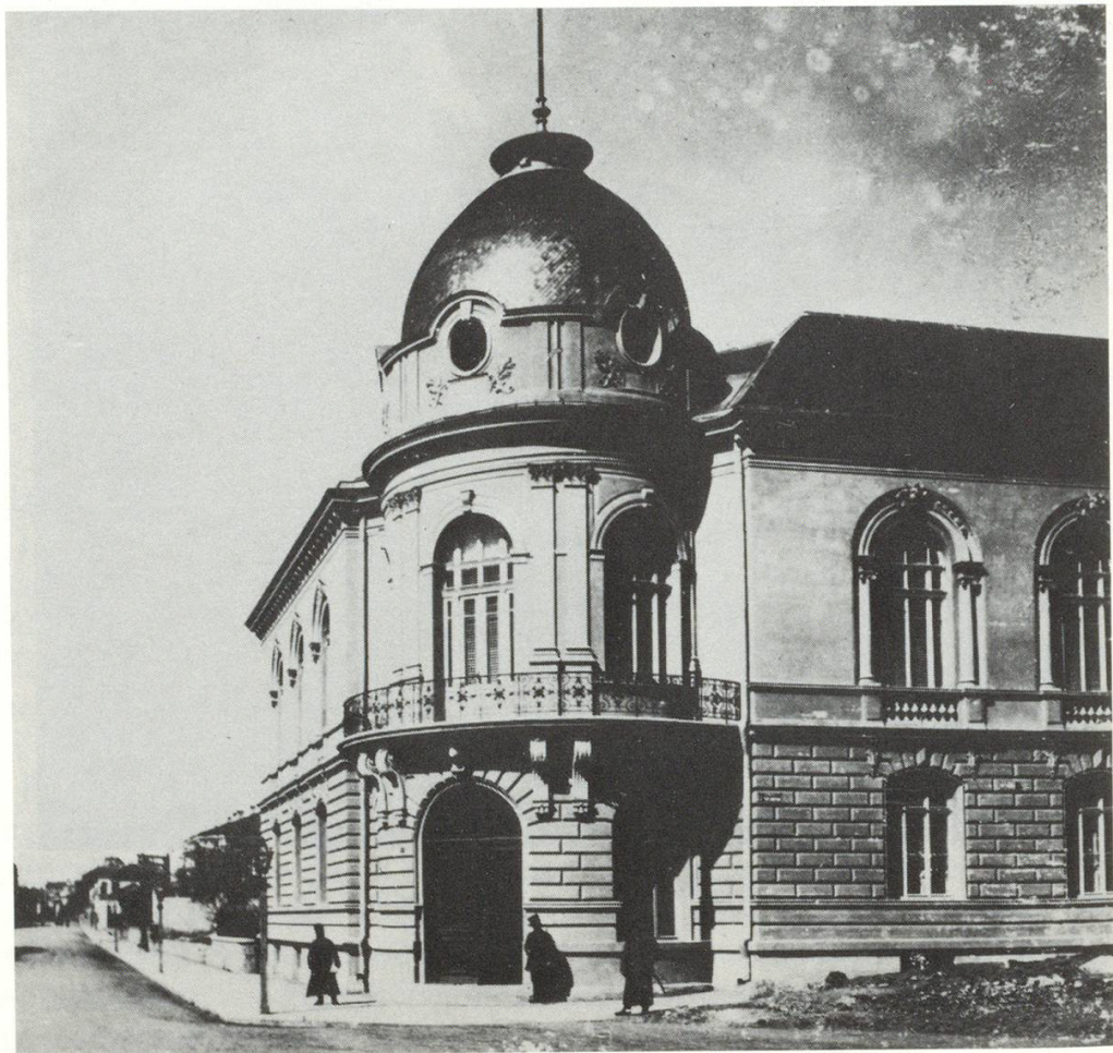
Gebäude des Bulgarischen Lesevereins in Sofia, heute Sitz der Akademie der Wissenschaften