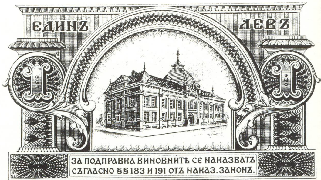
1-Lew-Banknote mit Hauptsitz der Bulgarischen Nationalbank in Sofia, erbaut von Henri Meyer