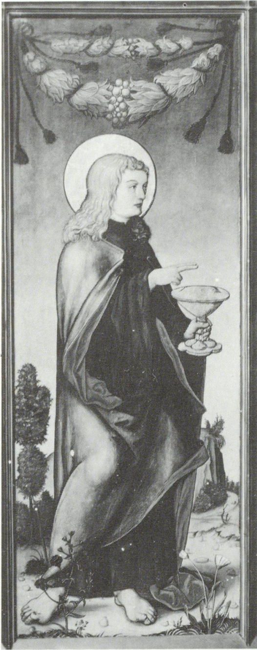
Abb. 6 Andreas Haider, Hl. Johannes Ev., um 1516, Donaueschingen, Fürstlich Fürstenbergische Sammlungen