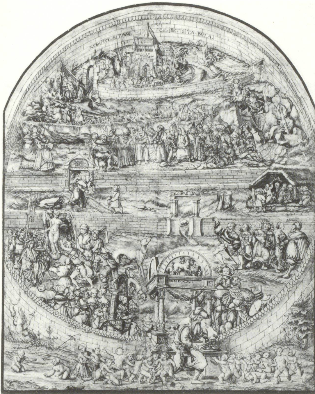
Abb. 10 Conrad Schnit alias Appodeker, Cebes-Tafel (Handzeichnung), 1521, Weimar, Staatliche Kunstsammlungen