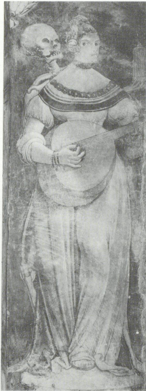
Abb. 7 Andreas Haider, Der Tod und die Lautenspielerin (1516), Stein am Rhein, Kloster St. Georgen