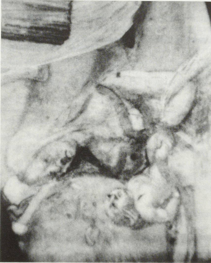
Abb. 1 und 2 Thomas Schmid zugeschrieben, Der Kindermord von Bethlehem, um 1515?, Schaffhausen, Museum zu Allerheiligen, Ausschnitte, Infrarotreflektographie der Unterzeichnung