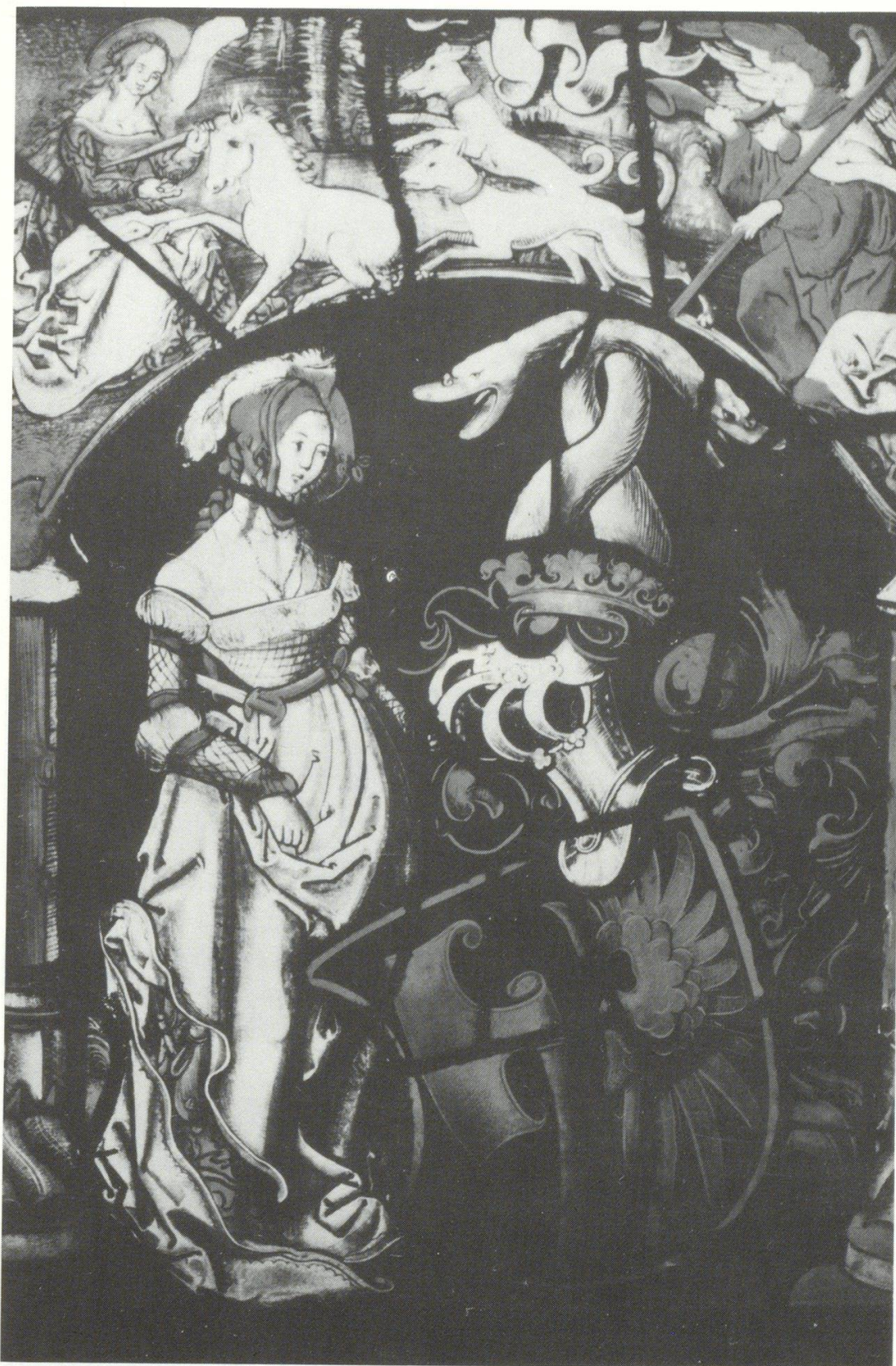
Abb. 3 Konstanzer Meister?, Wappenscheibe der Familie Lichtenfels (?), um 1515, Cleveland, Museum of Art