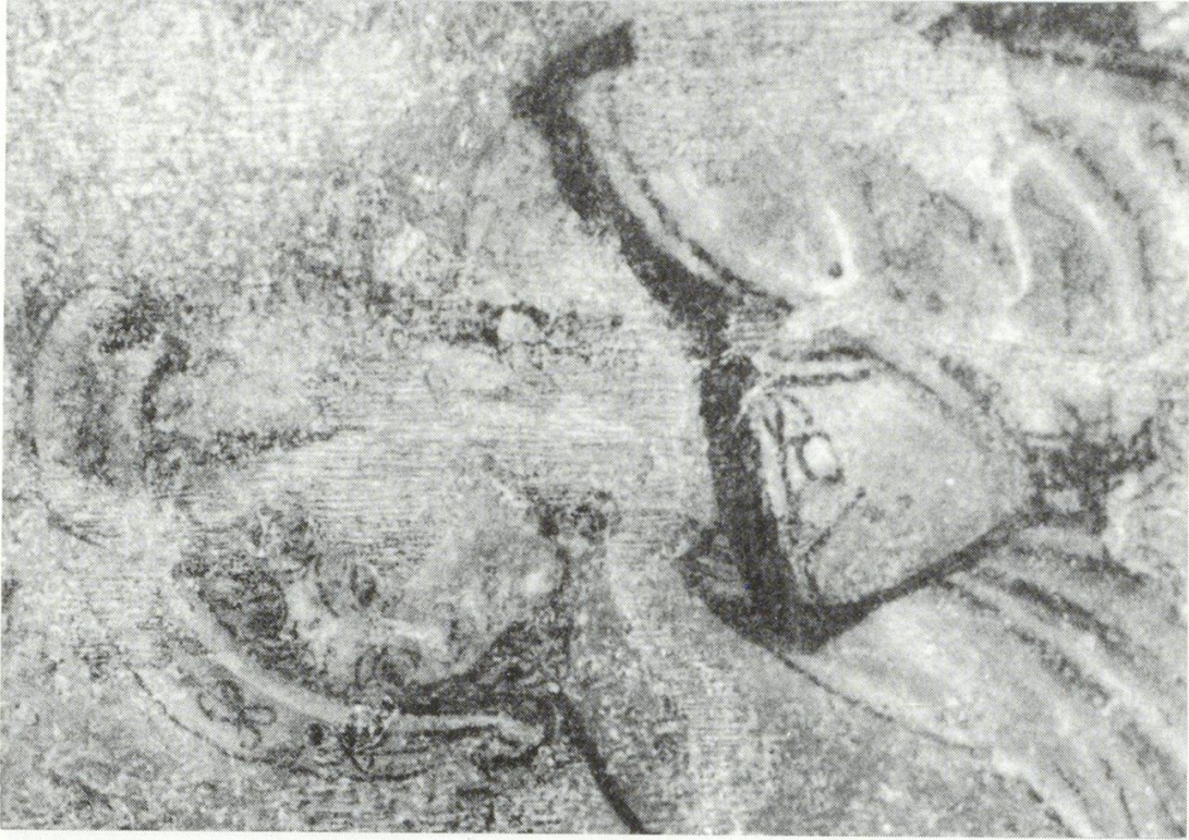
Abb. 5 Hans Holbein d. Ä., Die Aussetzung von Romulus und Remus (1515), Stein am Rhein, Kloster St. Georgen, Ausschnitt