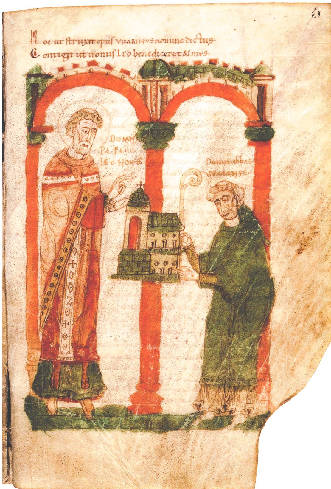
1 Papst Leo IX. weiht die Abteikirche von St. Arnulf in Metz. Miniatur, Metz, um 1100. Burgerbibliothek Bern, Cod. 292, fol. 73r.