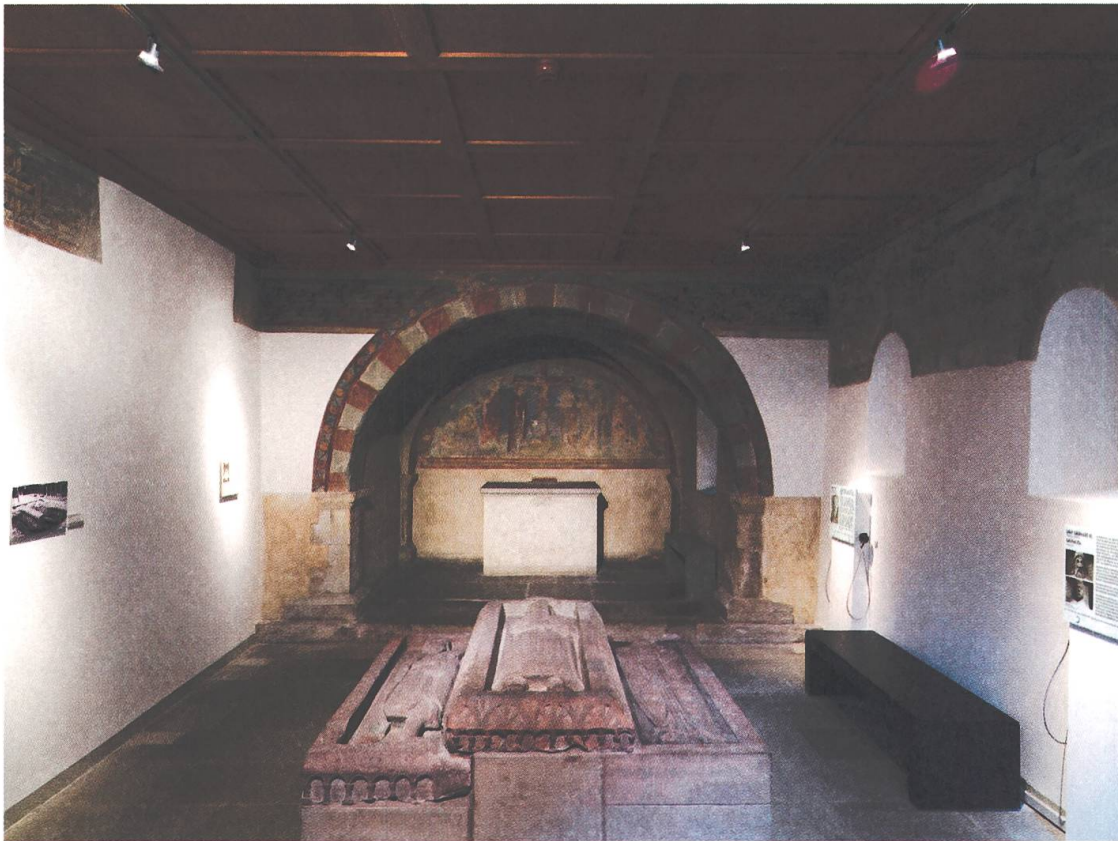
4 Erhardskapelle im Museum zu Allerheiligen, Schaffhausen, mit dem 1928 dort aufgestellten Stiftergrab.