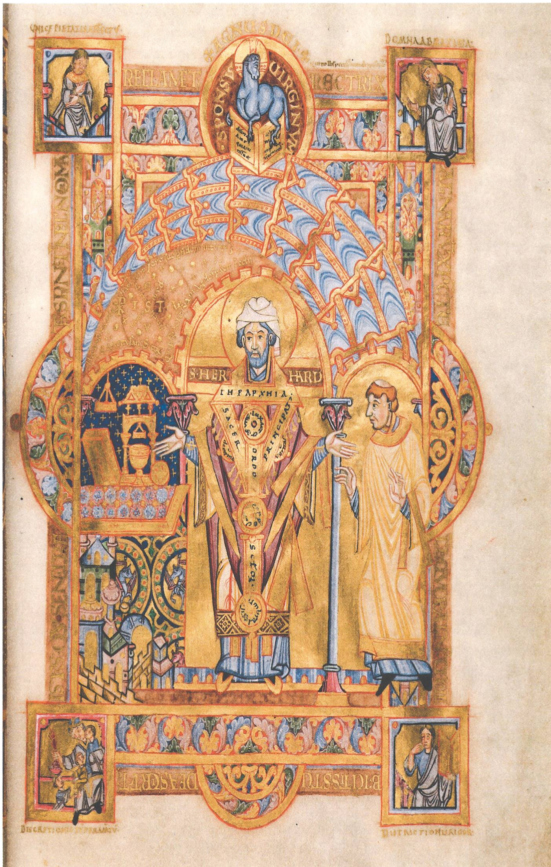
5 Meister des Uta-Codex, Der hl. Erhard liest die heilige Messe. Miniatur, Regensburg, um 1020. München, Bayerische Staatsbibliothek, Clm 13601, fol. 4r.