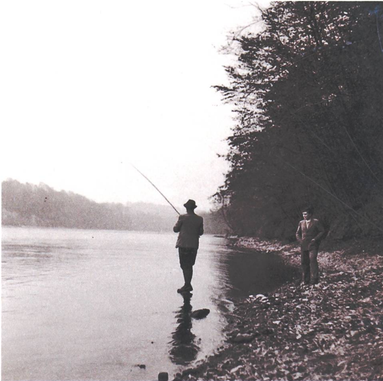
2 Angelfischer am Rhein (?), um 1950.