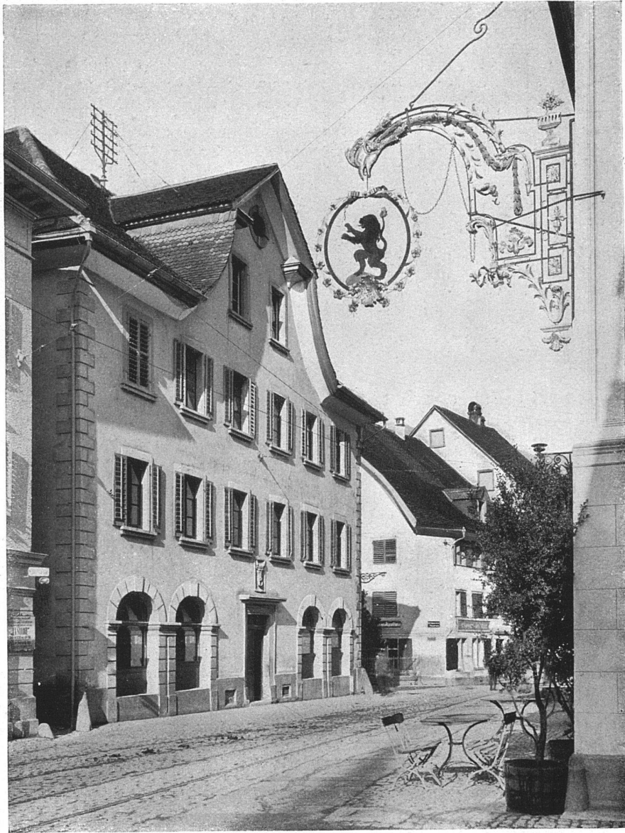
Die „Ankenwaage“ in Altdorf (erbaut 1824)