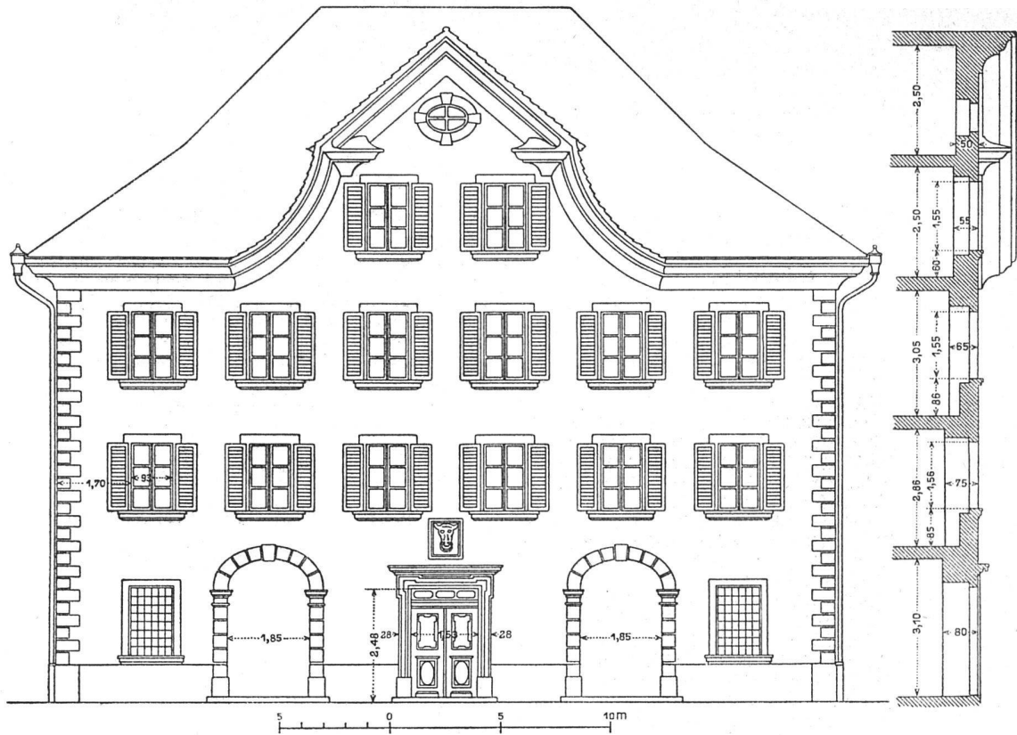
Geometrische Ansicht der Hauptfassade mit Schnitt. — Maßstab 1:150. — Die Fassade ist zur Zeit im Erdgeschosß umgebaut, hier aber nach alten Angaben im ursprünglichen Zustand gezeichnet