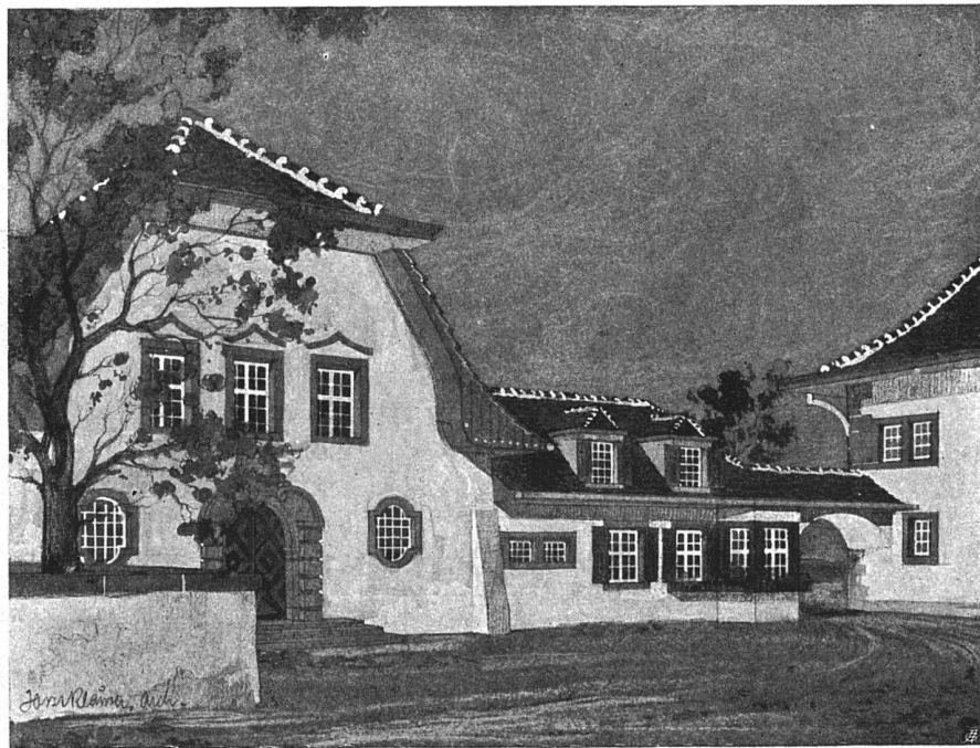
Schulhäuser für Tavannes