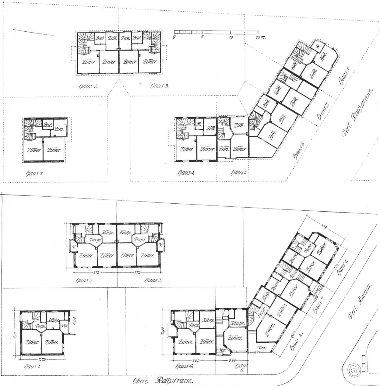
Gruppe von Einfamilienhäusern an der oberen Rohstrasse in Zürich IV. — Grundrisse vom Erdgeschoss und Oberstock. — Maßstab 1:400. (Bergl. S. 153, 154)

Der neue Schlachthof der Stadt Zürich, dessen ungefähr 20 kleinere und größere Gebäude auf einem eingefriedeten Gelände von 44 000 Quadratmetern an der Stadtgrenze gegen Altstetten zu liegen, ist am 2. August dem Betrieb übergeben worden. Fünf Schlachthallen für Großvieh, Kleinvieh, Schweine,