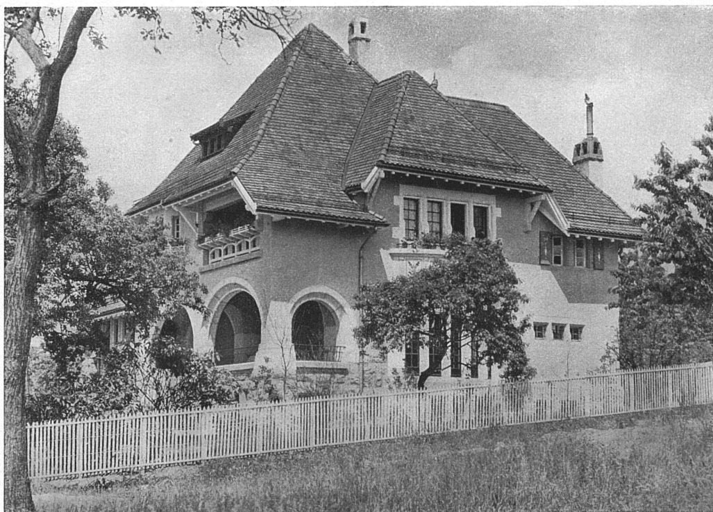
„La Rosiaz“ bei Lausanne. — Architekt (B. S. A.) G. Epitaur, Lausanne

Aus „Villen und Landhäuser in der Schweiz.“ — Von Architekt (B. S. A.) Henry Baudin, Genf Verlag für Kunst und Architektur, Genf, Rue St. Durs 6