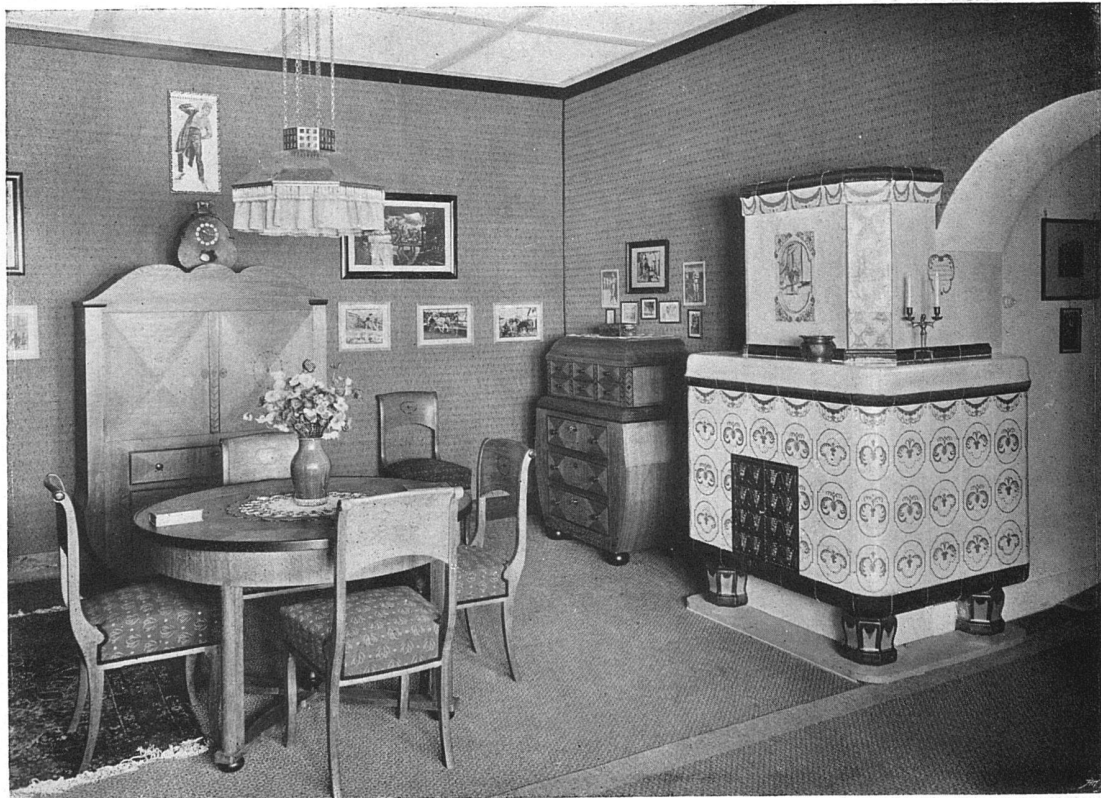
Herrenzimmer in Eichen geräuchert mit Ebenholz-Intarsien. — Von Architekt (B. S. A.) Hans Klausner, Bern Die Raumkunstausstellung 1910 in Bern