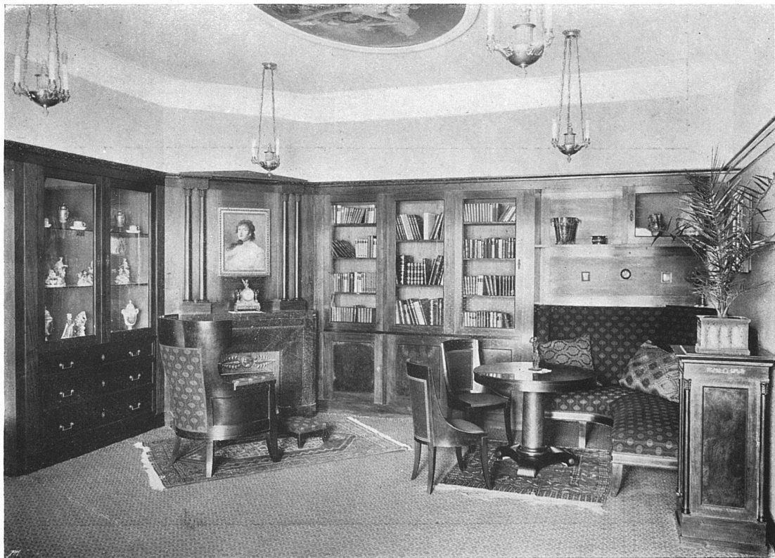
Herrenzimmer eines Sammlers. — Von den Architekten Lindt & Hofmann, Bern Die Raumkunstausstellung 1910 in Bern