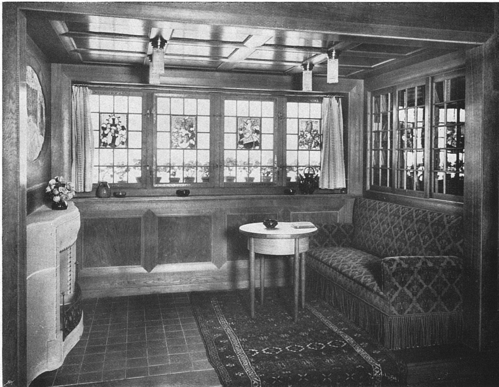
Wohn- und Esszimmer (Stube) in geräuchertem Eichenholz. Von Architekt (V. S. A.) Karl In der Mühle, Bern Die Raumkunstausstellung 1910 in Bern