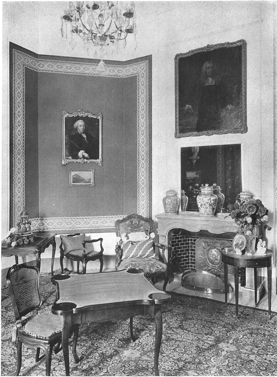
Boudoir eines Berner Landstües. — Von Architekt H. B. von Fischer, Bern

Raumausführung von Wetli & Cie, Möbelfabrik, Bern; Stukkaturen von Jos. Fevradá, Bern; Bemalung von Giordano & Carmelino, Bern. Möbel, Wand- und Fensterdekoration von Wetli & Cie, Bern