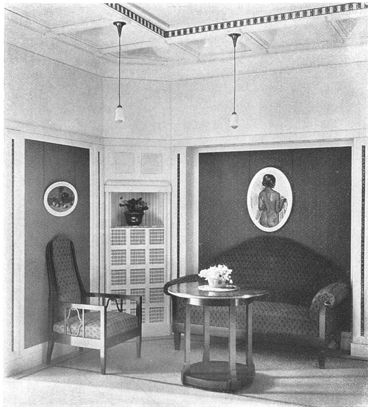
Ausführung von Hugo Bagnier, Kunstgewerbl. Werkstätten f. Wohnungseinrichtung, Bern. — Beleuchtungsförder, Baumann, Kölliker & Cie., Zürich. — Tapezierarbeiten von W. Butterfass, Bern.