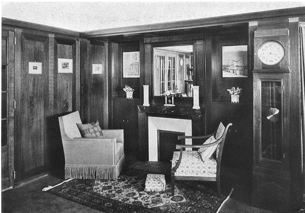
Wohnzimmer. — Von den Architekten Bracher & Widmer und Daxelshofer, Bern