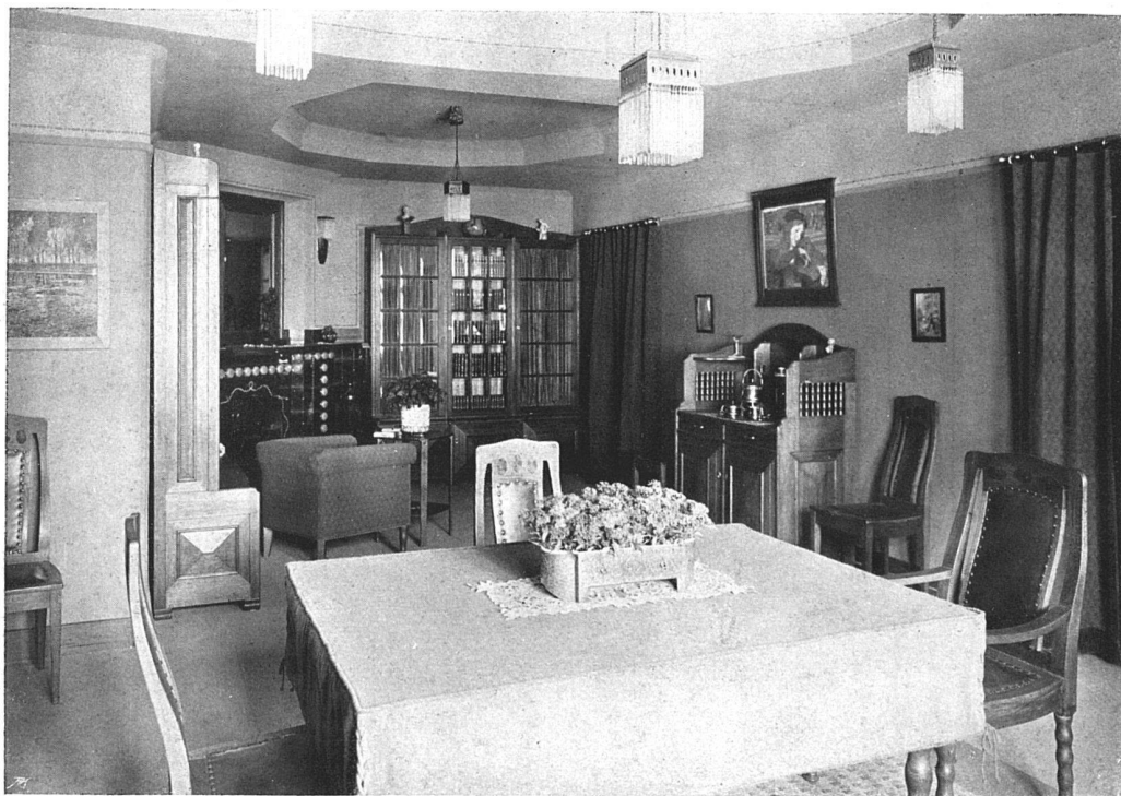
Speise- und Wohnzimmer für einen Beamten. — Von Architekt E. J. Propper, Biel