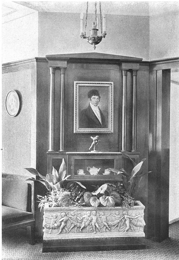
Ausführung der Schreiner- und Tapezierarbeiten v. Wetli & Cie., Bern. — Die Stuck- und Maler- arbeiten durch E. Haberer & Cie., Bern. — Deckengemälde von Otto Haberer, Gmütligen