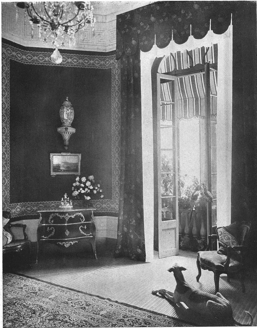
Boudoir eines Berner Landstüches. — Von Architekt H. B. von Fischer, Bern