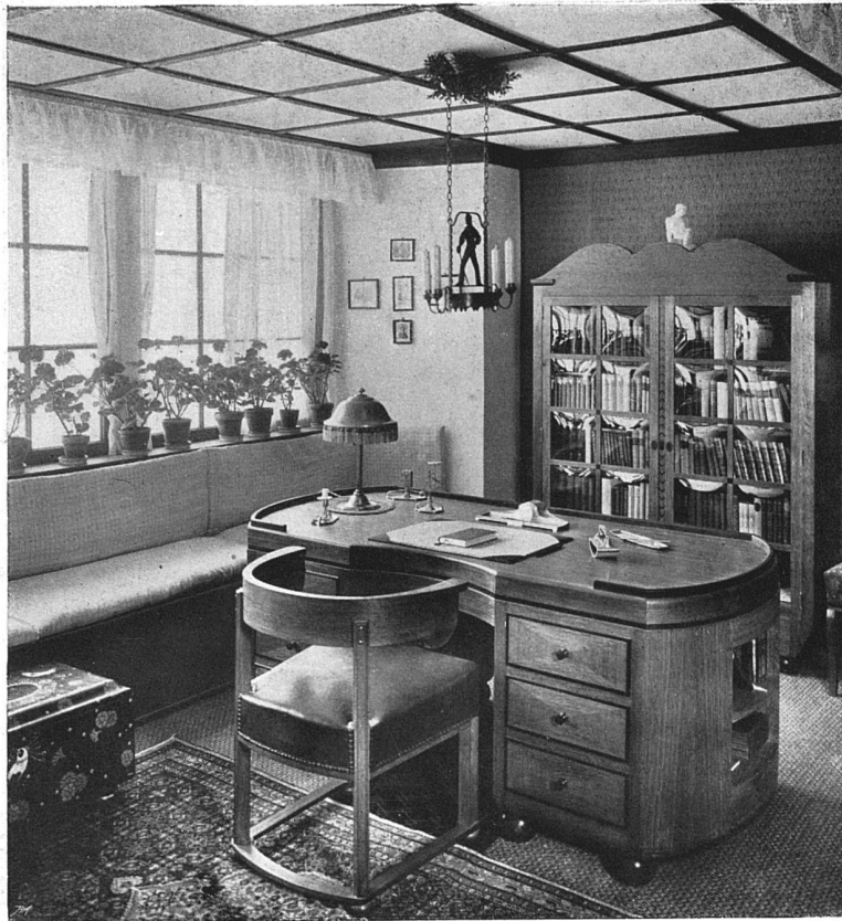
Ausführung der Möbel durch C. Leuch; Ebenist, Mattenhof, Bern. — Wandbespannung, Polster- arbeiten usw. von Th. Schärer, Tapezier, Bern