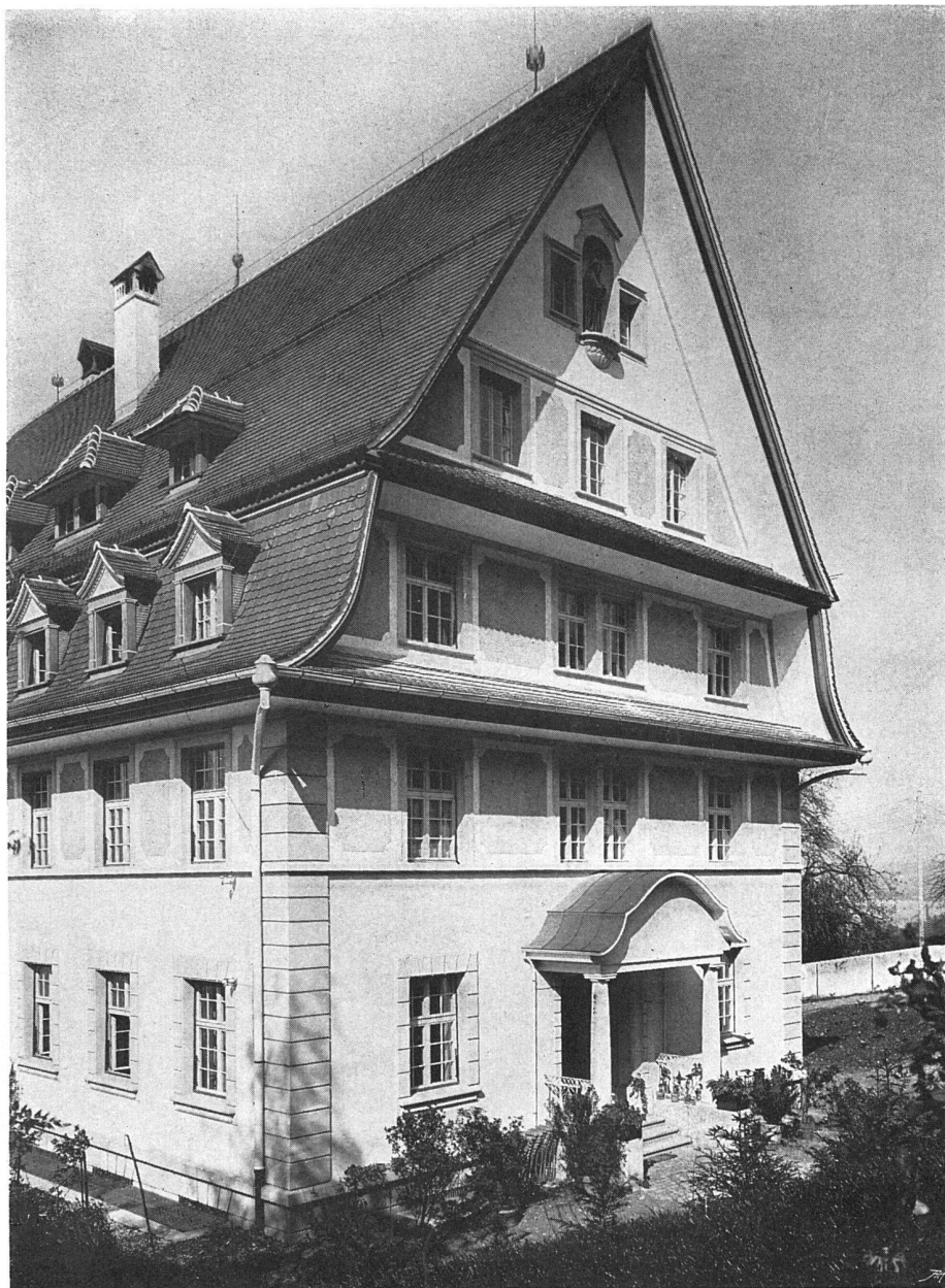
Ansicht der Ostfassade mit dem Haupteingang