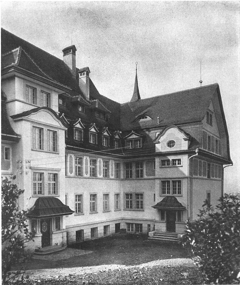
Ansicht der Nordfassade

Das Nervenanstorium „Franziskusheim“ in Oberwil bei Zug