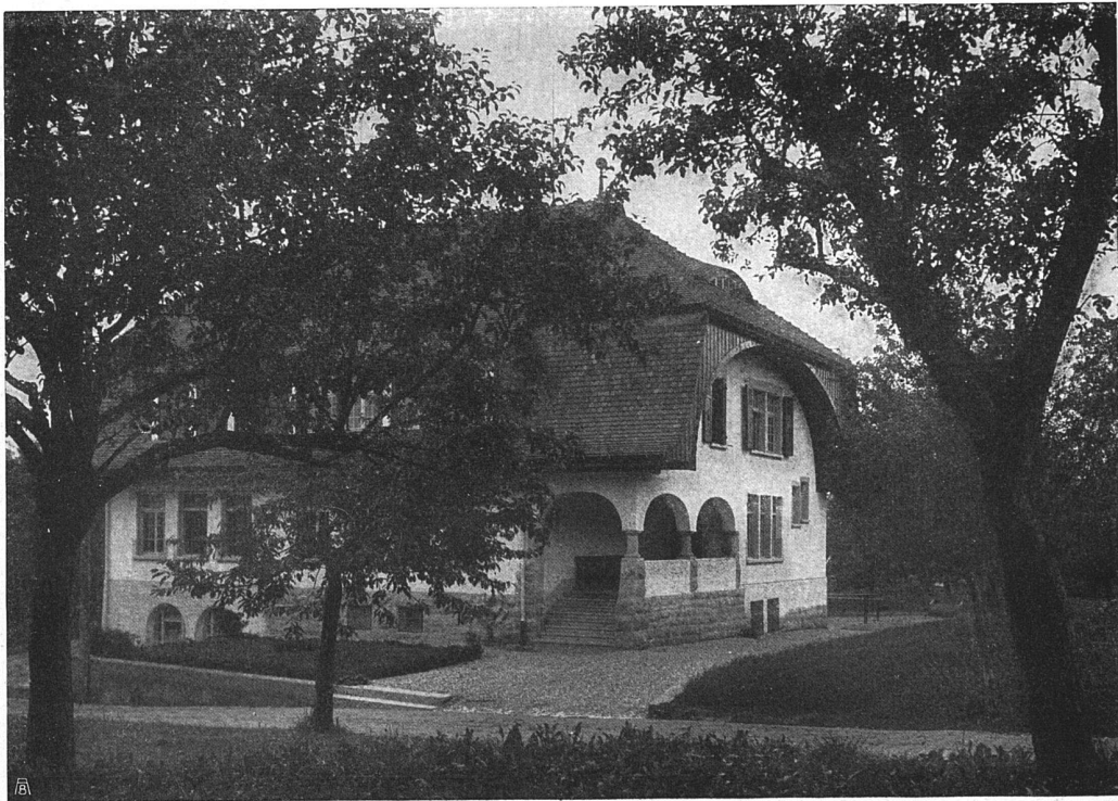
Das Sekundarschulhaus in Lützelstüh