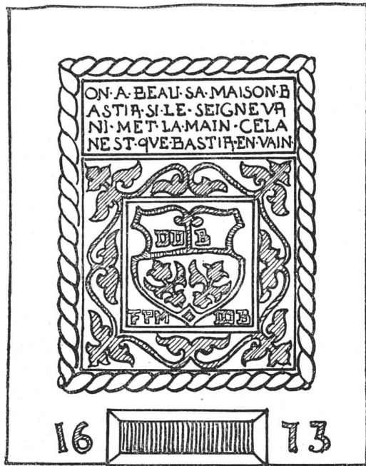
Abb. 2. Inschrifttafel aus dem Neuenburger Jura

Nun einiges über die Hausprüche. Wo so ein sinniger Spruch über der Haustür steht, wird einem gleich warm und wohlilig und gerne gibt jeder dem Gedanken Raum, daß in solchem Hause gute Menschen wohnen müssen. Beim Jurahaus ist die Inschrift meist an den Sopraporten angebracht. Eng zusammengedrängt, in römischen