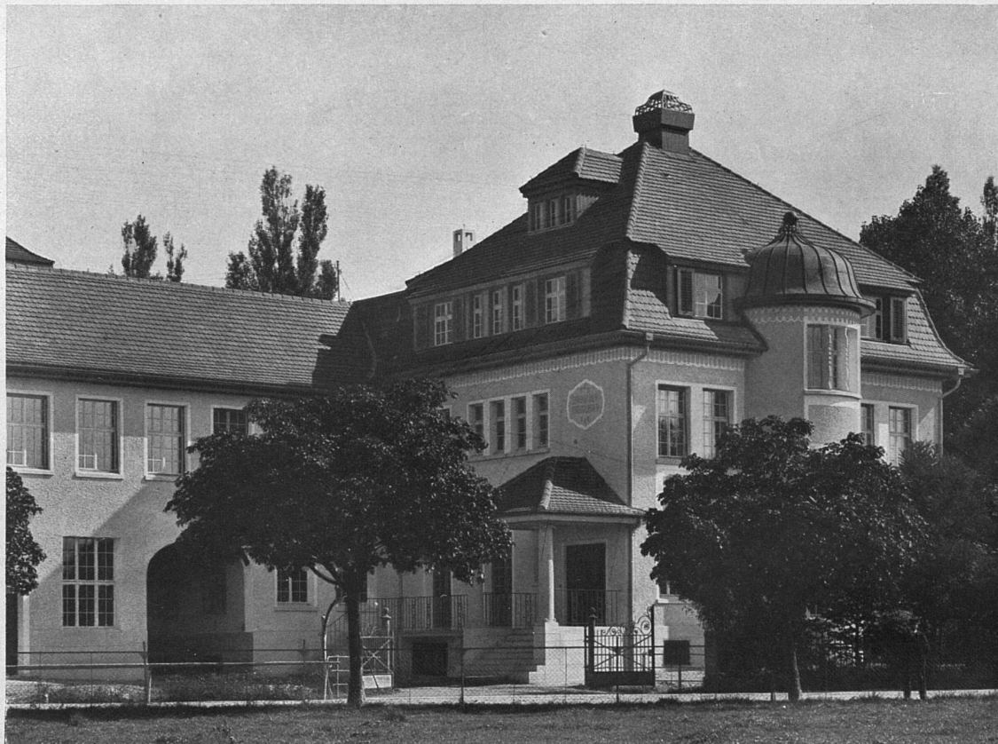
Ansicht des Bureaugebäudes.