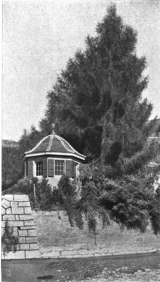
Der Pavillon auf der Seemauer