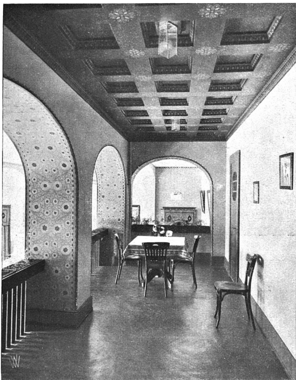
Musiklaube im Speisesaal