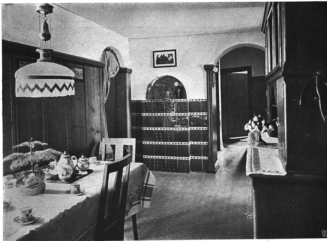
Blick in die Wohnstube

Wohnhaus-Ums- und Anbau in Chur von Architekt J. Willy in Chur