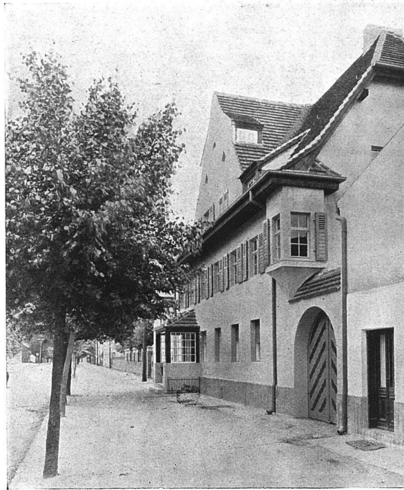
Gemeindevorsteherhaus in Neuenhagen, Dorf bei Berlin