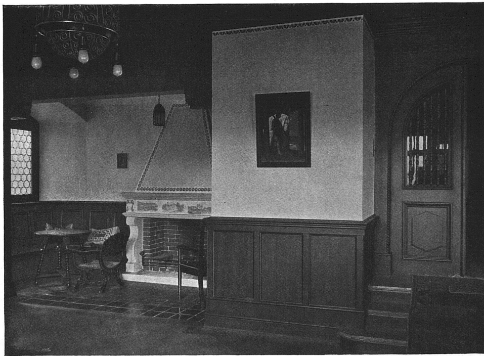
Kaminecke in der Halle. — Die Kaminkacheln sind mit Ansichten alter Schlösser der Familie von Hallwil bemalt.