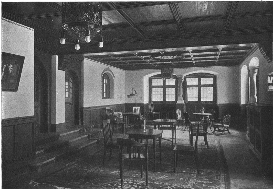
Blick in die Halle an Stelle der früheren Küchen- und Wirtschaftsräume. — Holzwerk braun.

Der Umbau der Kuranstalt «Brestenberg» am Hallwilersee. Architekt Eugen Probst, Zürich.