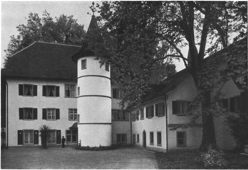
Ansicht der Nordseite mit Haupteingang. Der Umbau der Kuranstalt «Brestenberg» am Hallwilersee. Architekt Eugen Probst, Zürich.