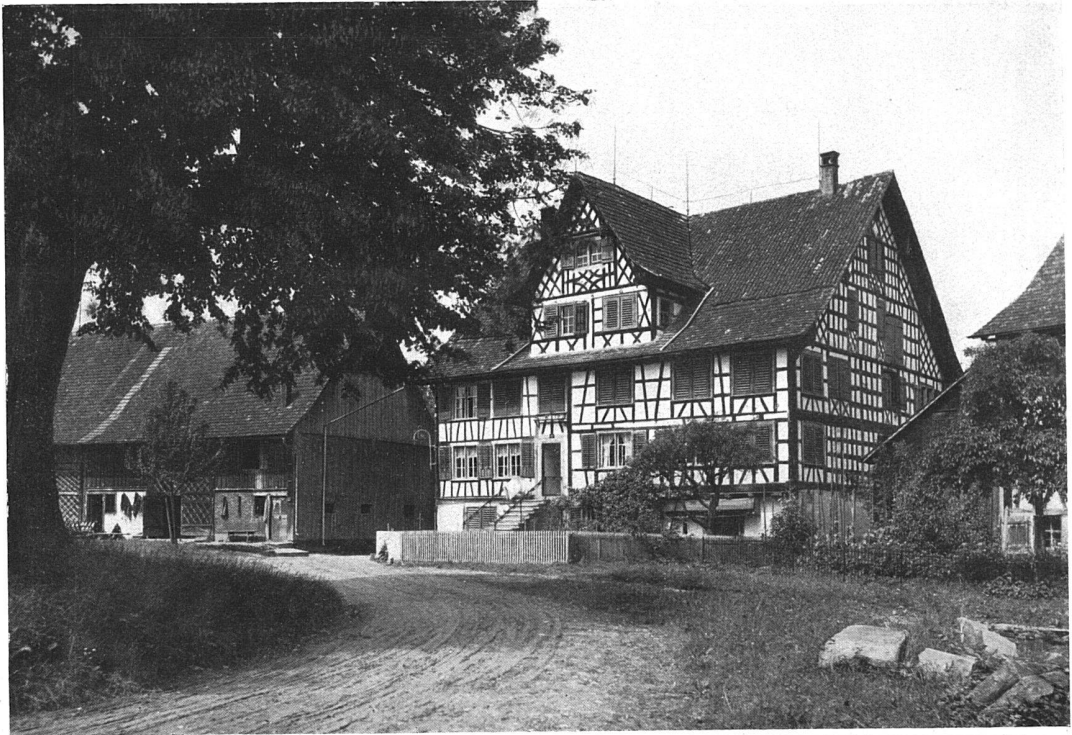
Bauernhof zu Roggwil im Kanton Thurgau.