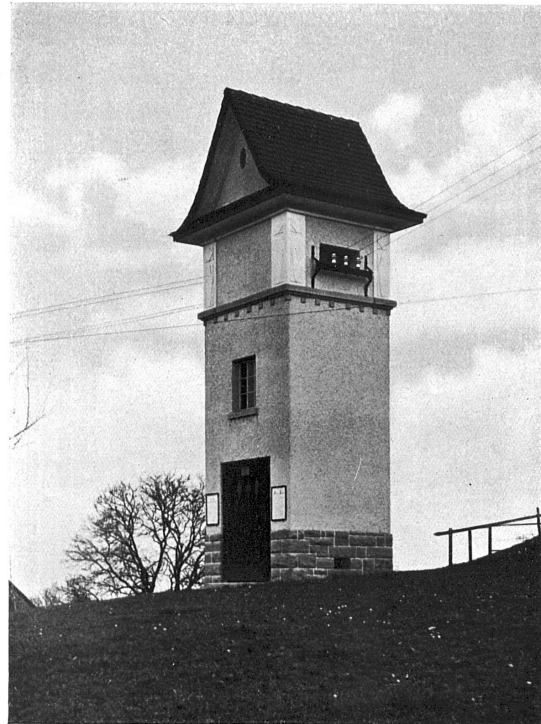
Transformatorhäuschen bei Meggenhusen (Kt. St. Gallen). Ausgeführt vom Kantonsbauamt des Kantons St. Gallen.