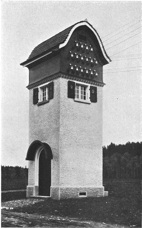
Transformatorhäuschen bei der landwirtschaftlichen Winterschule zu Münsingen. F. u. H. Könitzer, Architekten, Worb.