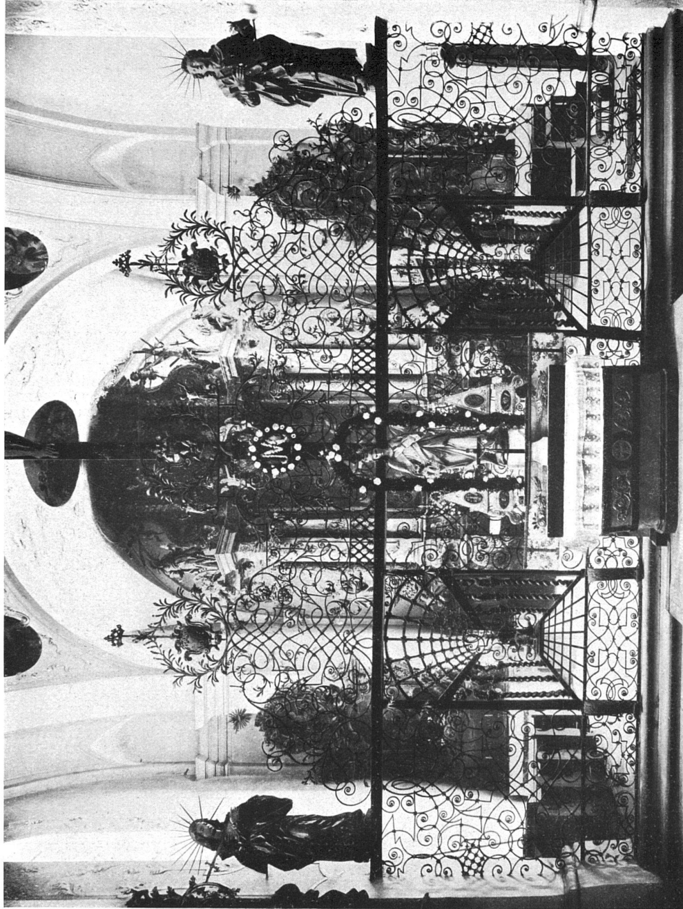
Das Chorgitter in der Kirche des ehemaligen Benediktiner-Frauenklosters zu Münsterlingen (Kt. Thurgau).

von drei bis vier Entwürfen stehen 4000 Fr. zur Verfügung. Die preisgekrönten Arbeiten gehen in den Besitz des Hospices über. Dem Verfasser des ersten Preises wird die Ausarbeitung der Baupläne und die Bauleitung übertragen. Verlangt werden: Ein Lage-