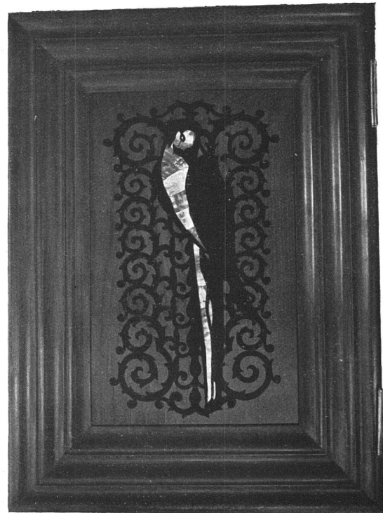
Schloss Hülchrath bei Düsseldorf des Herrn E. R. v. Bennigsen. Türchen der Heizkörperverkleidungen im Schlafzimmer des Herrn. Architekt Otto Zollinger, Zürich 7, Zeltweg.