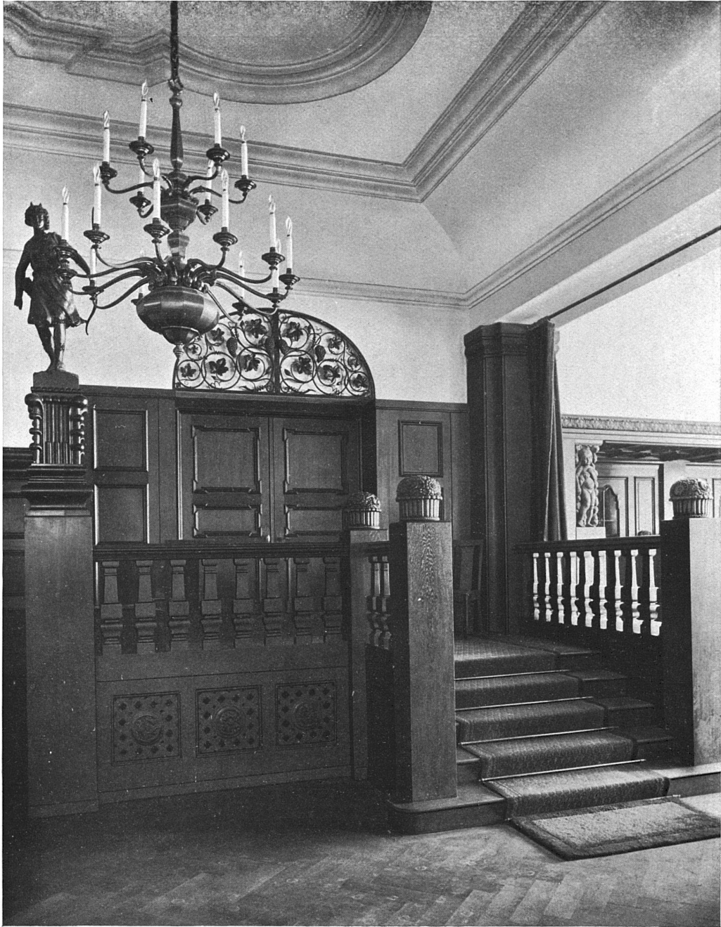
Eingangspartie im Restaurant des Hotels Central zu Lausanne. — Architekt J. Austermeier, Lausanne. In geräucherter Eiche ausgeführt von der Möbelfabrik H. Aschbacher, Zürich.