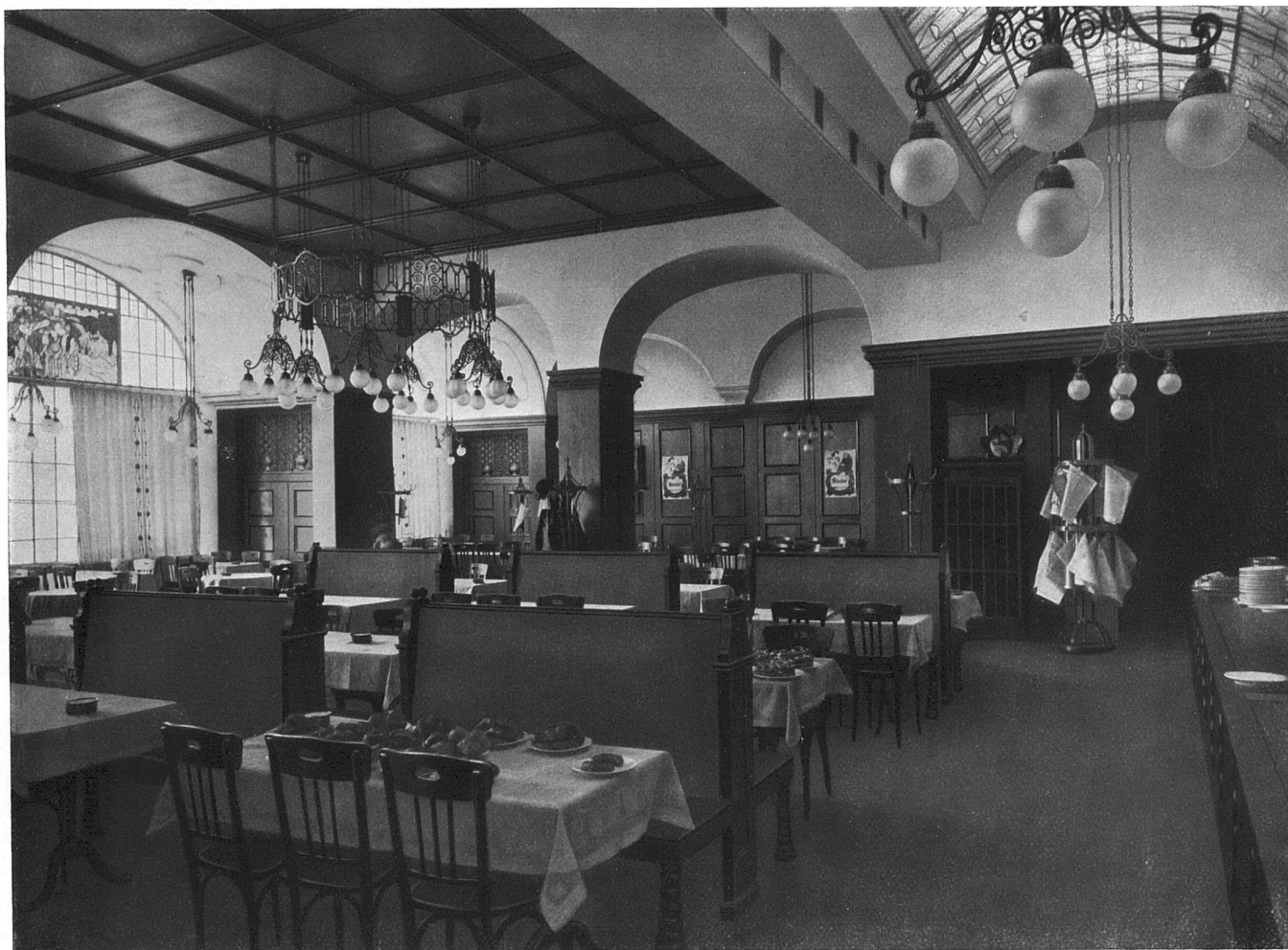
Das Bierrestaurant im Hotel Central zu Lausanne. — Architekt J. Austermeier, Lausanne. In geräucherter Eiche ausgeführt von der Möbelfabrik H. Aschbacher, Zürich