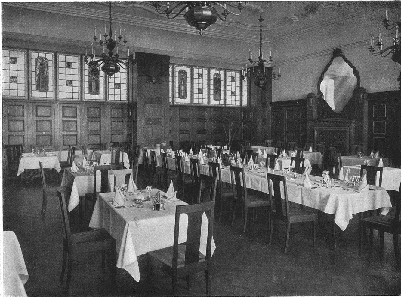
Das Weinrestaurant im Hotel Central zu Lausanne. — Architekt J. Austermeier, Lausanne. In geräucherter Eiche ausgeführt von der Möbelfabrik H. Aschbacher, Zürich.