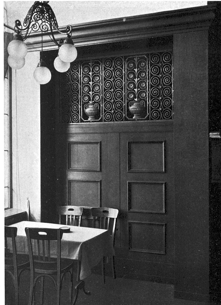
Nische im Bier-Restaurant.

Aus dem Hotel Central zu Lausanne. — Architekt J. Austermeier, Lausanne. Ausgeführt von der Möbelfabrik H. Aschbacher, Zürich.