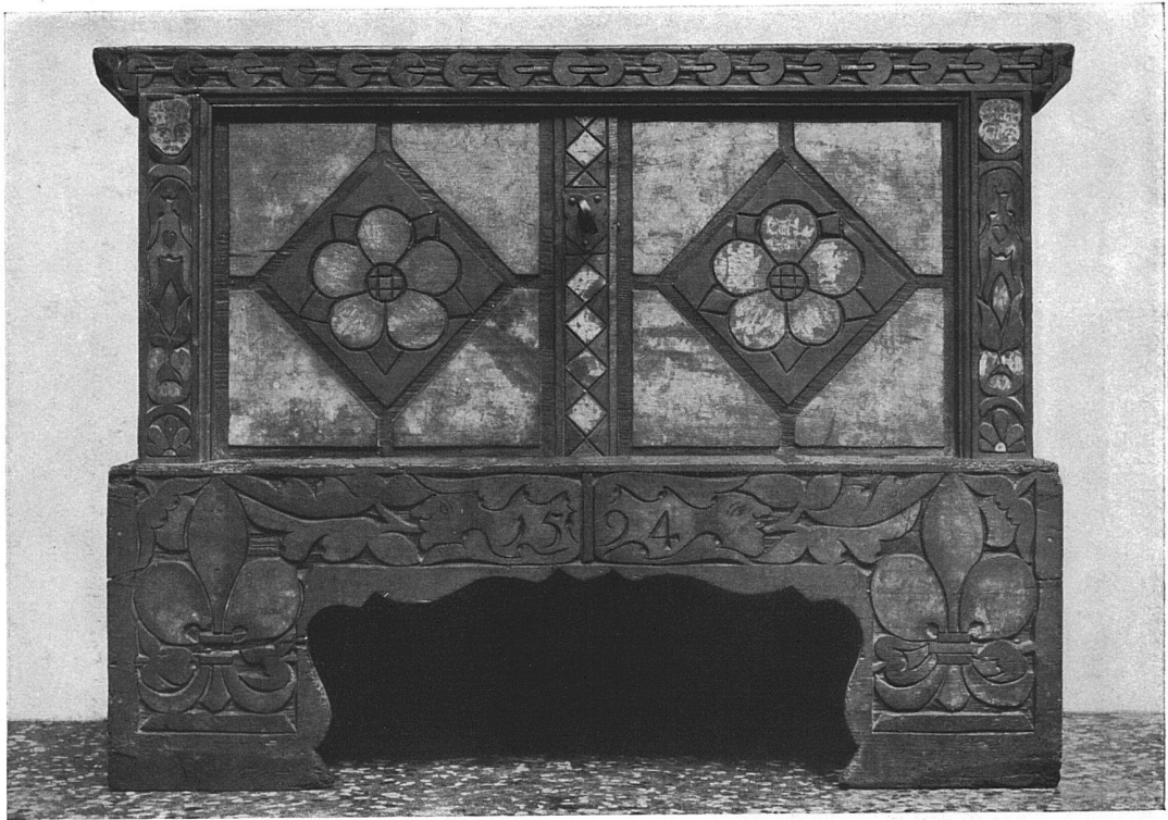
Gotische Truhe mit Renaissance-Ornamentik, von 1594. Im Historischen Museum zu Basel.