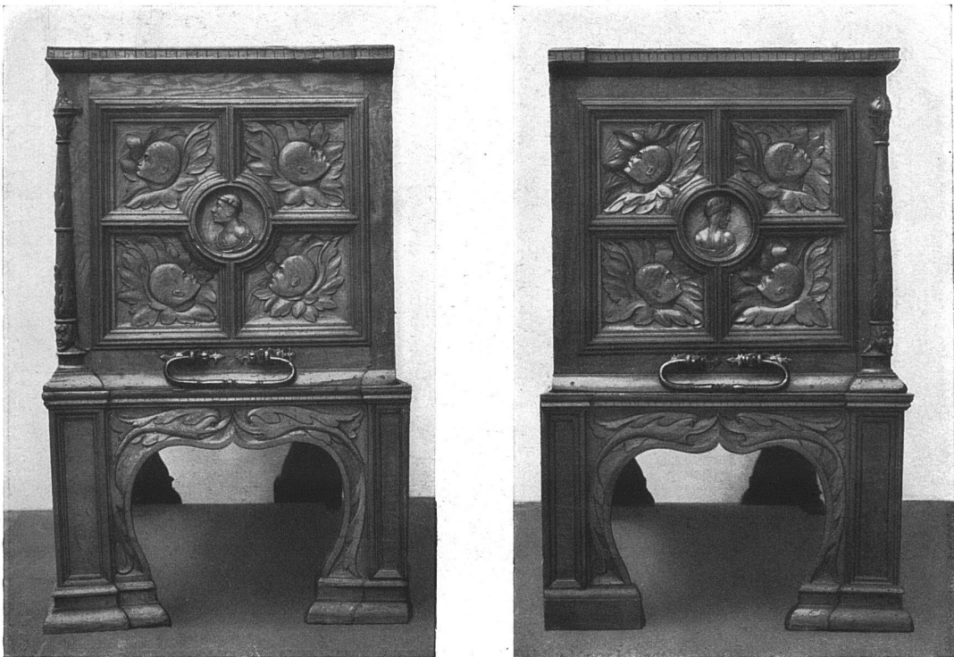
Basler Renaissance-Truhe von 1539. — Die Seitenwände. Im Historischen Museum zu Basel. (Vgl. die Vorderansicht auf der nächsten Seite.)