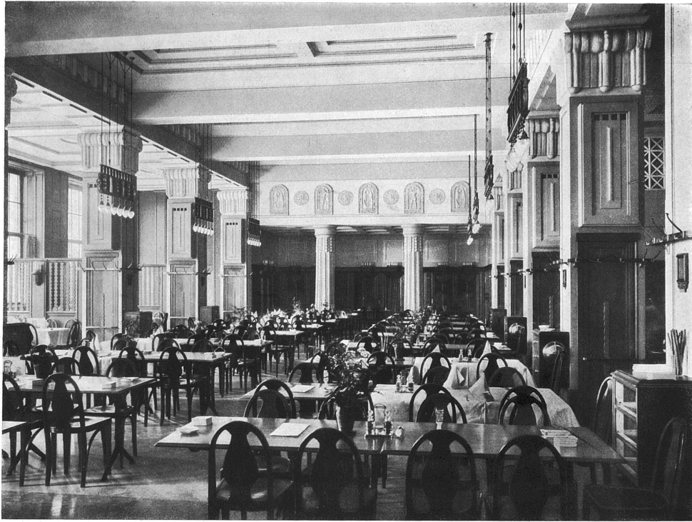
Das grosse Restaurant im Hause Du Pont zu Zürich. — Architekten Haller & Schindler, Zürich.

Schreinerarbeiten in geräuchertem Eichenholz mit Verwendung von helleren und dunkleren Hölzern von Rob. Furtwängler, Zürich; Stühle in dunkler Eiche mit schwarz; Decke und Säulen hell mit leichtem, stumpfen Grün; Wandbespannungstoff goldgelb; Linoleum grau mit schwarzen Einlagen.