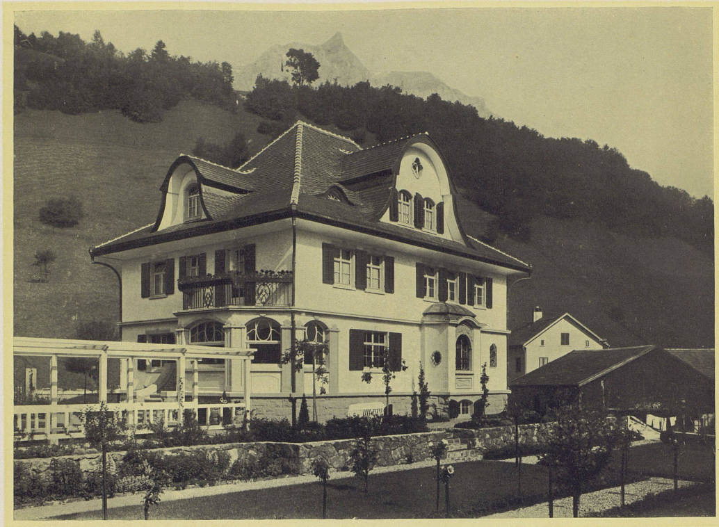
Das Wohnhaus «Eichenhaus» des Herrn Redaktor Rudolf Tschudy zu Glarus. — Die Südfassade. Architekt Fr. Glor-Knobel, Glarus.