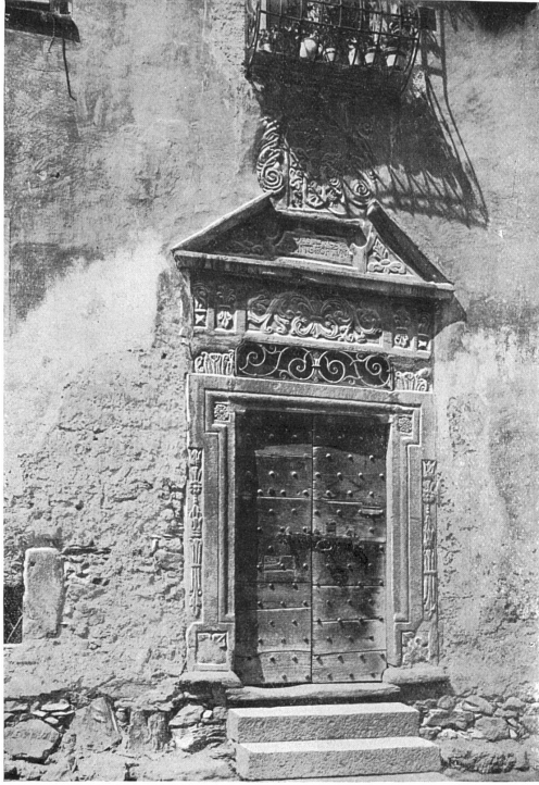
Portal eines Hauses in Valendas.