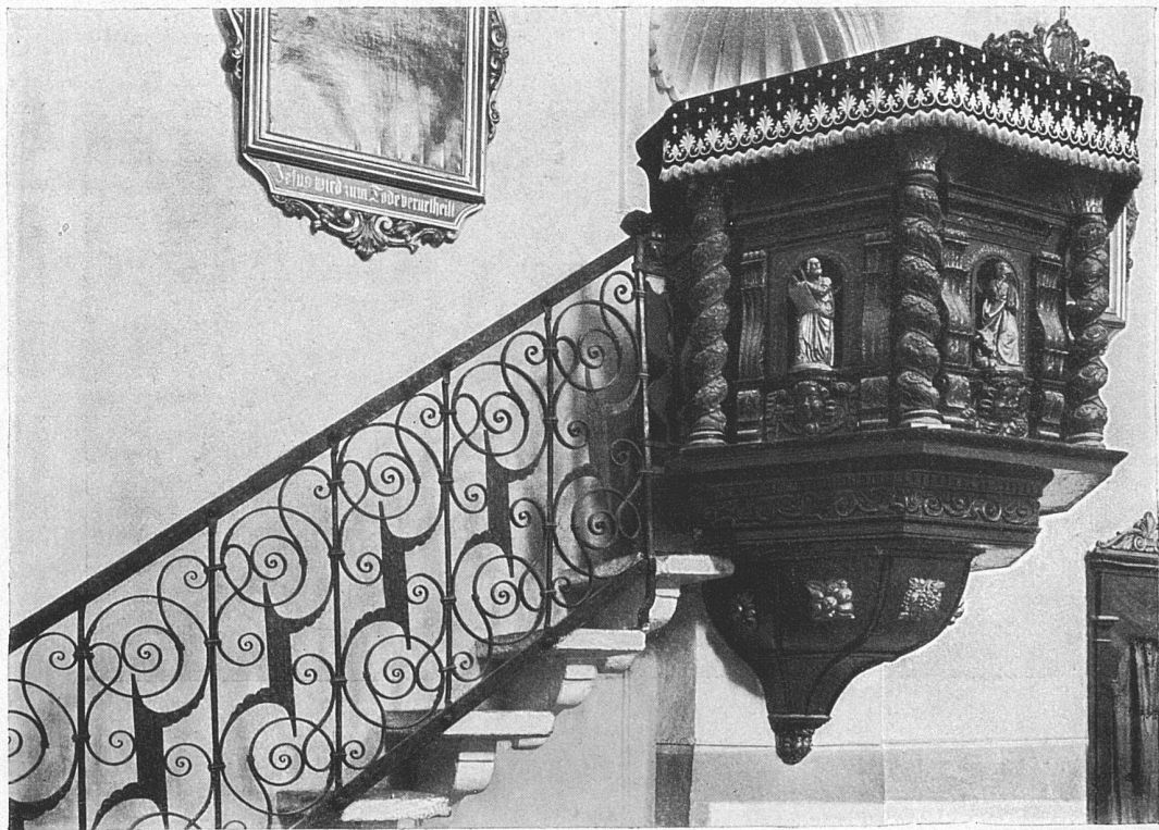
Die Kanzel in der Kirche zu Viège (Kt. Wallis).