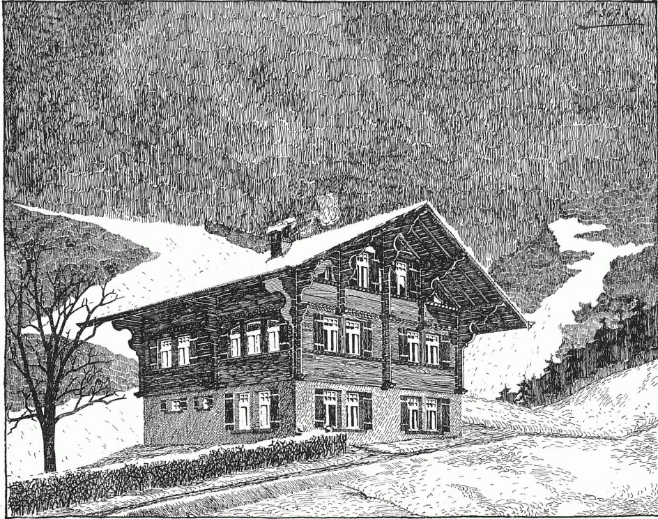
Chalet für Herrn Holzach in Gstaad. Entworfen und ausgeführt von dem Architekturbureau und Baugeschäft v. Grünigen, Reichenbach & Co., Saanen (Kt. Bern).