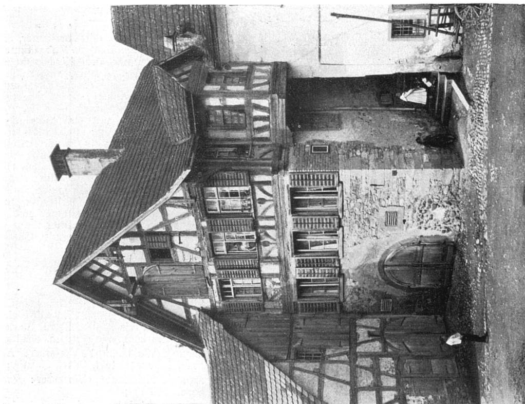
Altes Haus in Steckborn.