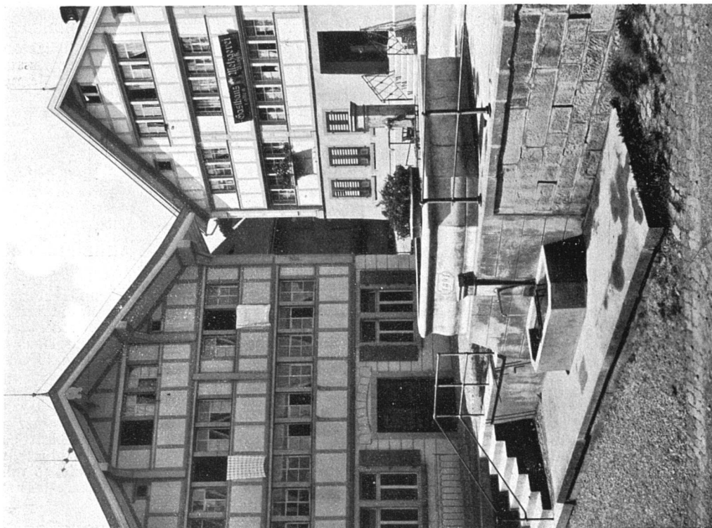
Aus Urnäsch.