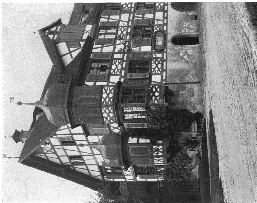
Altes Haus in Gottlieben (Drachenburg). — Aus der Sammlung «Heimatschutz im Thurgau». Aufnahmen von E. Hausmann, Heiden.