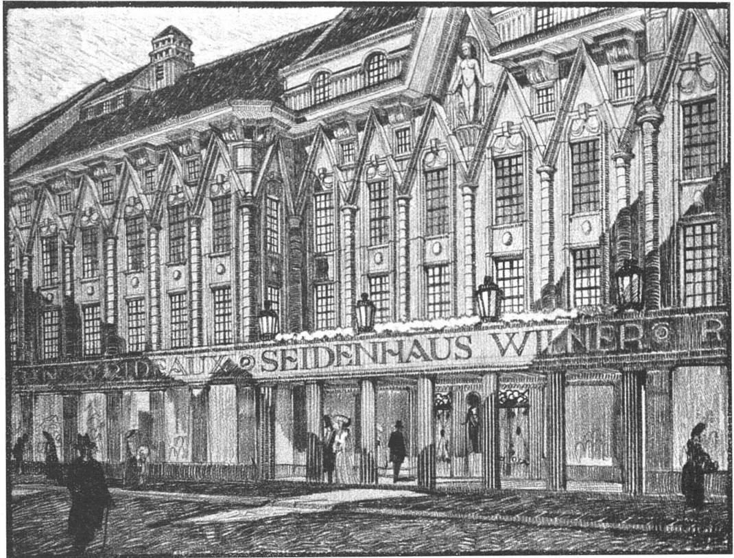
Entwurf zu einem Geschäftshause. — Schaubild. Architekt Maximilian Lutz, Thun.

Strassenfuhrwerken zugänglich. Im Parterre wird man nach der offenen Vorhalle, wo die Eintrittskarten gelöst werden und durch das Vestibul in den grossen Zentralraum gelangen, der durch alle Geschosse hindurchgeht und dem Besucher sofort eine leichte Orientierung ermöglicht. Die Messe-räume sind auf sechs Geschosse verteilt. Sie bedecken insgesamt zirka 30 000 Quadratmeter. Das Parterre ist fast ausschliesslich der Gross-Industrie reserviert, ohne bestimmte Abgrenzung für die einzelnen Ausstellungs-räume. Die übrigen Geschosse sind dagegen in Kabinen eingeteilt und enthalten durchwegs Garderoben, Auskunftsbureaus, zwei bis drei Schreib- und Diktierbureaus, zwei Konversationszimmer, Erfrischungsräume, Telephonkabinen. Die Trennwände zwischen den einzelnen Kabinen werden in einem Einheitsmass hergestellt, um ein rasches Verschwinden zu ermöglichen, derart, dass dem Wunsche der Aussteller Rechnung getragen und einzelne Kabinen leicht verkleinert oder vergrössert werden können. Im eigentlichen Verwaltungsgebäude werden ausser dem Messebureau noch ein Postamt, sowie