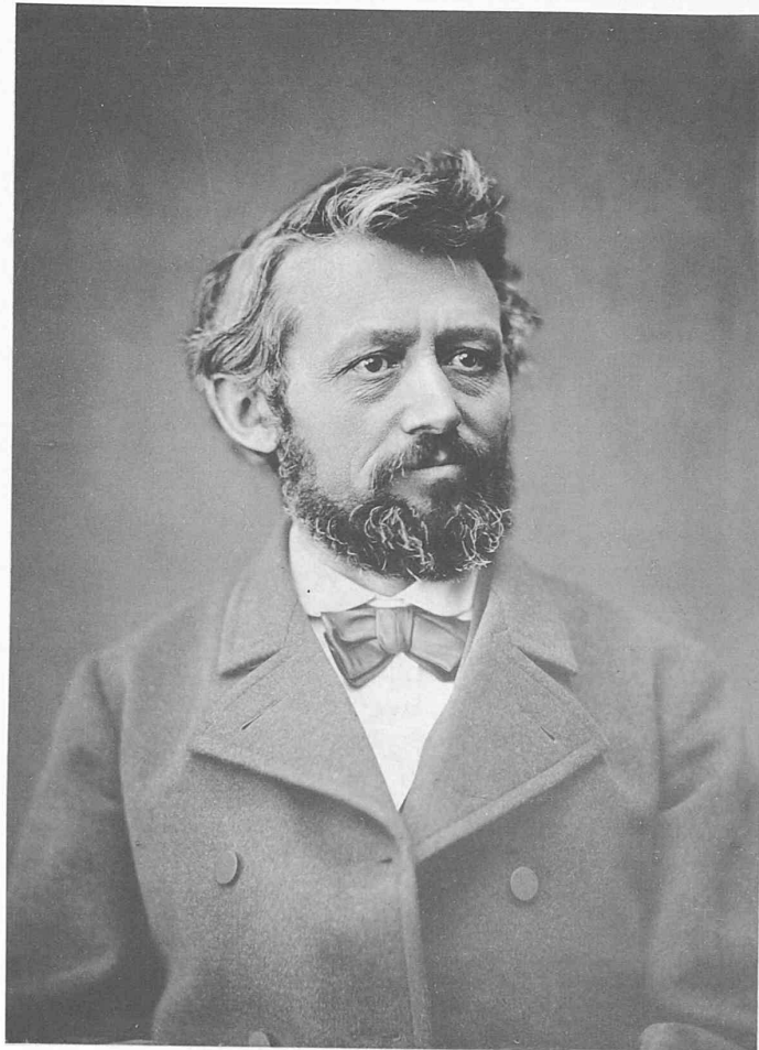
Professor Dr. Carl Culmann , gestorben den 9. Dezember 1881.