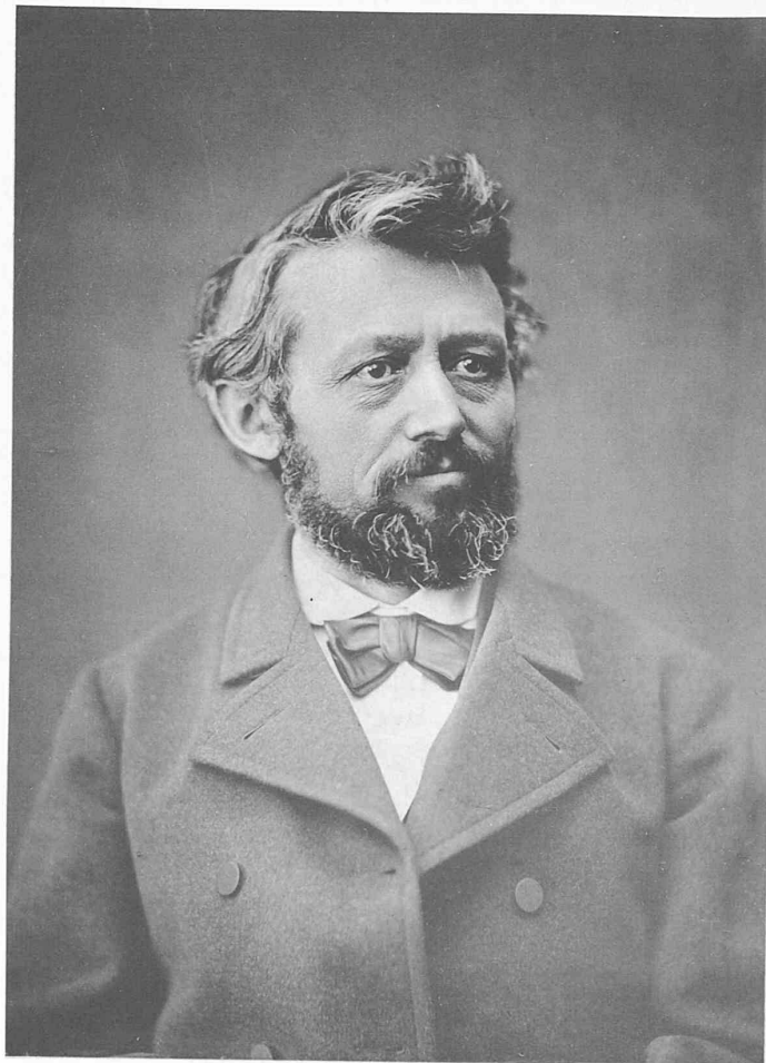
Professor Dr. Carl Culmann , gestorben den 9. Dezember 1881.