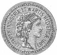
(M 5059 Z)