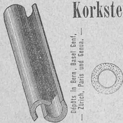
— Eisenbahn-Station: Niederhallwyl-Dürrenäsch —