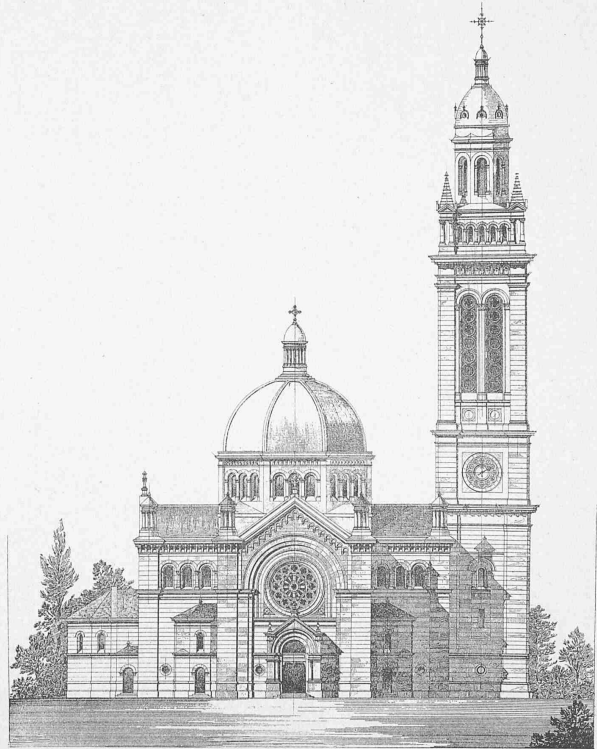
Masstab 1 : 500