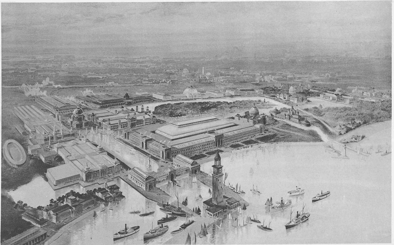
Die Kolumbische Weltausstellung in Chicago.