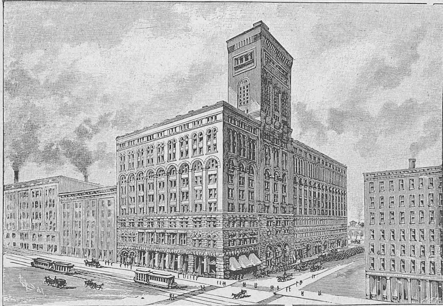
Das Auditorium-Gebäude in Chicago.

wenig zu, wenn einmal eine merkliche Ausbiegung eingetreten ist; sie nimmt rasch ab, sobald die Elasticitätsgrenze überschritten ist. Es ist mir daher ganz unverständlich, wie ein Stab, der unter seiner gewöhnlichen Belastung bis über diese Grenze hinaus beansprucht wird, noch fortfahren