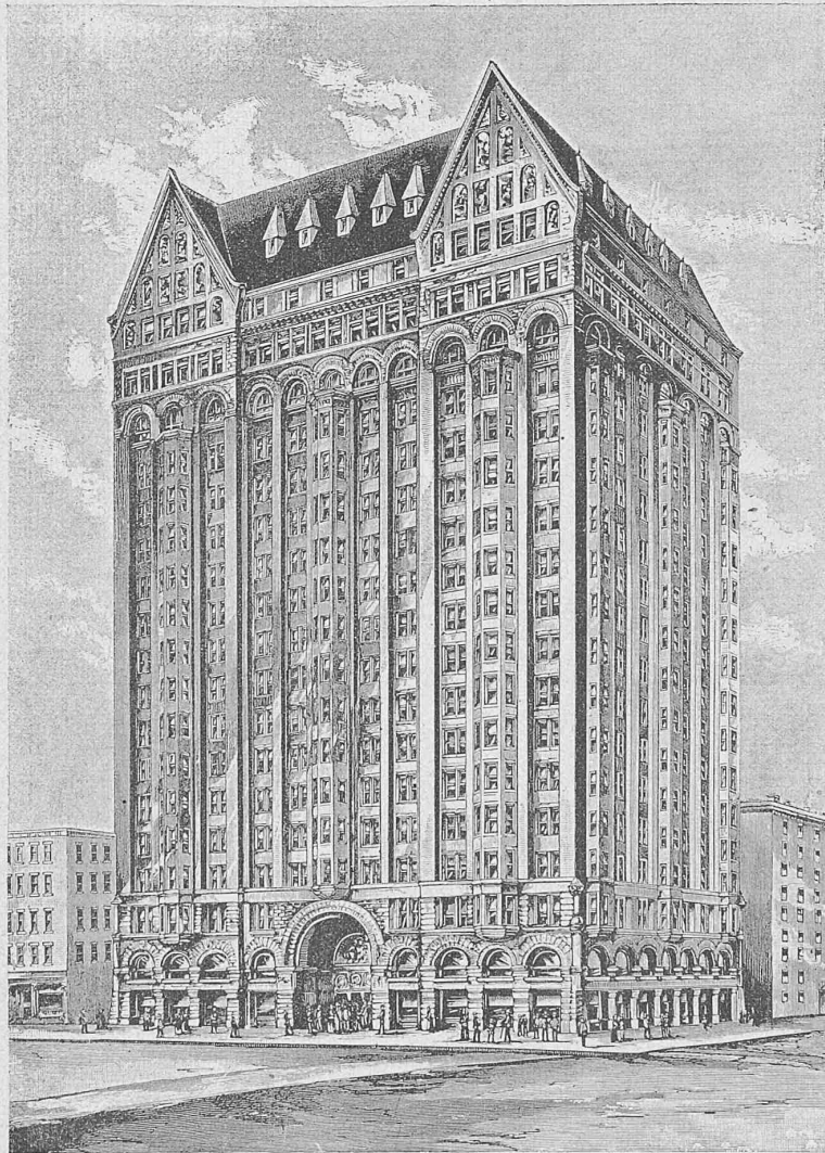
Der Freimaurer-Tempel in Chicago.

der Ansicht, dass wenn ein Druckstab zu stark beansprucht wird, er allmählich eine bleibende Verbiegung annimmt, aber gleichwohl fortfährt, seine Aufgabe zu erfüllen. „Dès que les poids roulants disparaissent, la pièce reprend sa disposition première, et c'est la répétition des efforts qui finit par laisser apercevoir une déformation permanente, qui est toujours un signe grave, bien qu'il n'indique pas un péril imminent.“ . . . „C'est ce qui explique qu'une barre ayant seulement la tendance à flamber peut montrer au bout d'une période plus ou moins longue des déformations permanentes, sans que ces déformations soient l'indice d'une situation désespérée.“ (S. 22 und 23.) Sie schliessen daraus weiter, dass wenn die mittleren Streben der Mönchensteiner Brücke zu geringe Knickfestigkeit gehabt