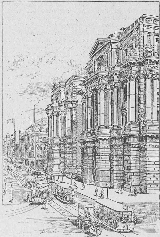
Courthouse an der Randolph-Strasse in Chicago.

fester cette faiblesse par une déformation permanente visible à l'oeil." (S. 42.)