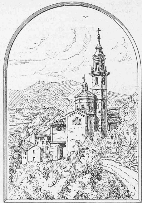
Nach einer Federzeichnung von Arch. F. Kühn.

Bertelot'sche Bombe viel zu teuer war. Sie bestand aus 1\frac{1}{2} kg Platin, so dass der Preis auf 5-6000 Fr. zu stehen kam. Seit der Einführung der Mahler'schen Bombe sind die Aussichten anders. In Frankreich, Holland, Belgien, Deutschland, Oesterreich, Amerika, England, Japan und jetzt auch hier in der Schweiz sind solche Bomben