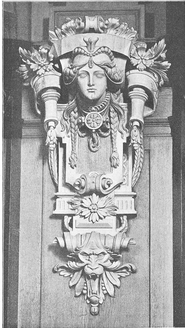
Panneel-Ecke mit Kartusche im Bundesrats-Sitzungssaale.