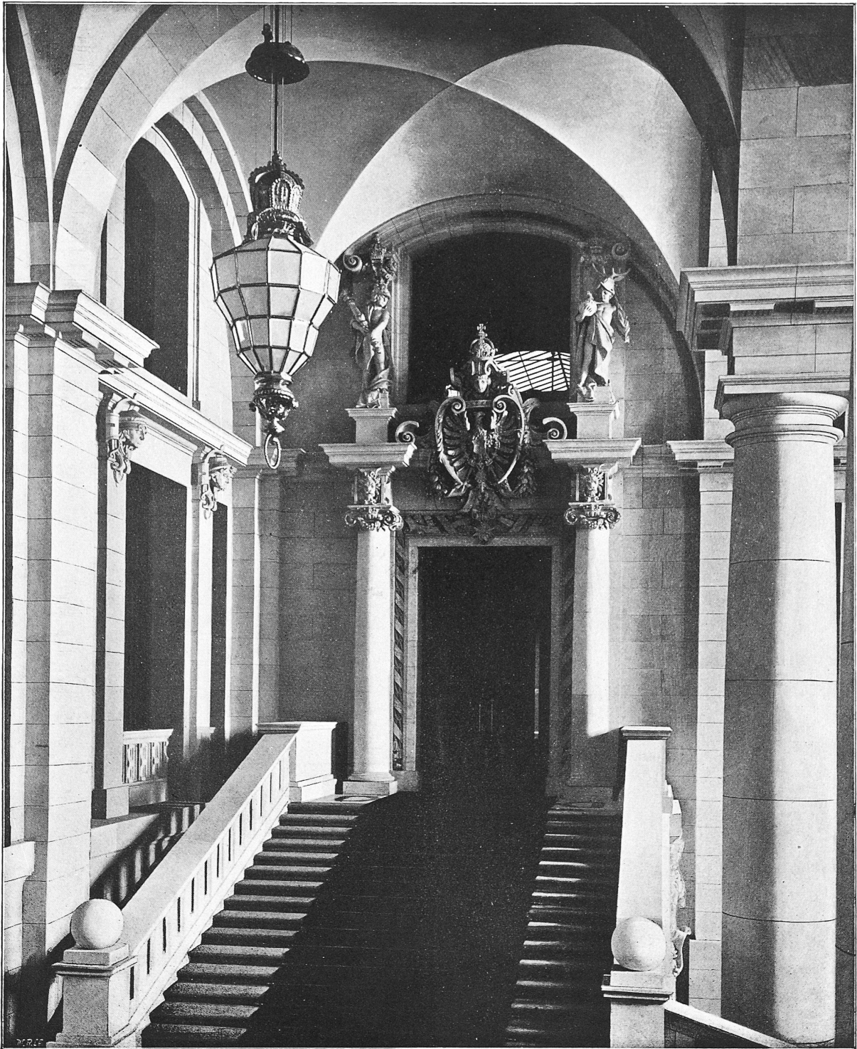
Innen-Ansichten des Deutschen Reichstagshauses zu Berlin.

Ost-Vorhalle und Treppen-Aufgang zum Vorsaal für den Reichstags-Vorstand.