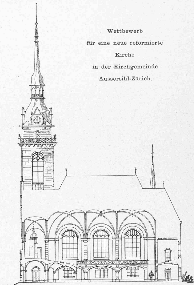
Längenschnitt 1 : 500.