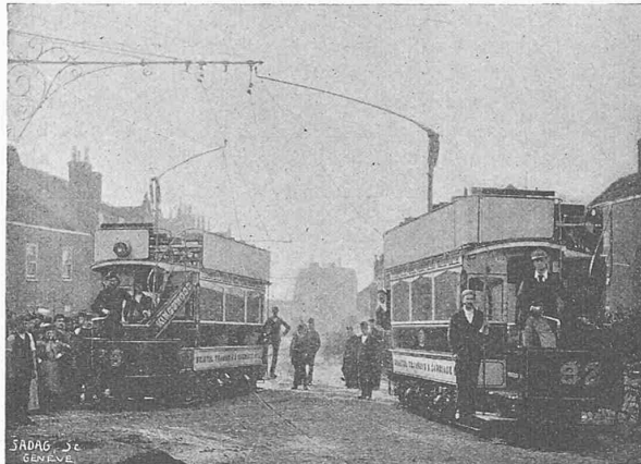
Fig. 1. Kreuzung auf der Linie Bristol-St. George-Kingswood.