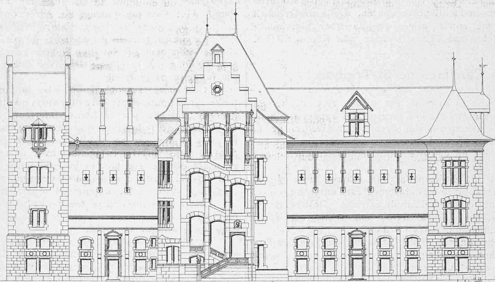
Hinterfassade. — Masstab 1 : 500.

Architekten: Lambert & Stahl in Stuttgart.