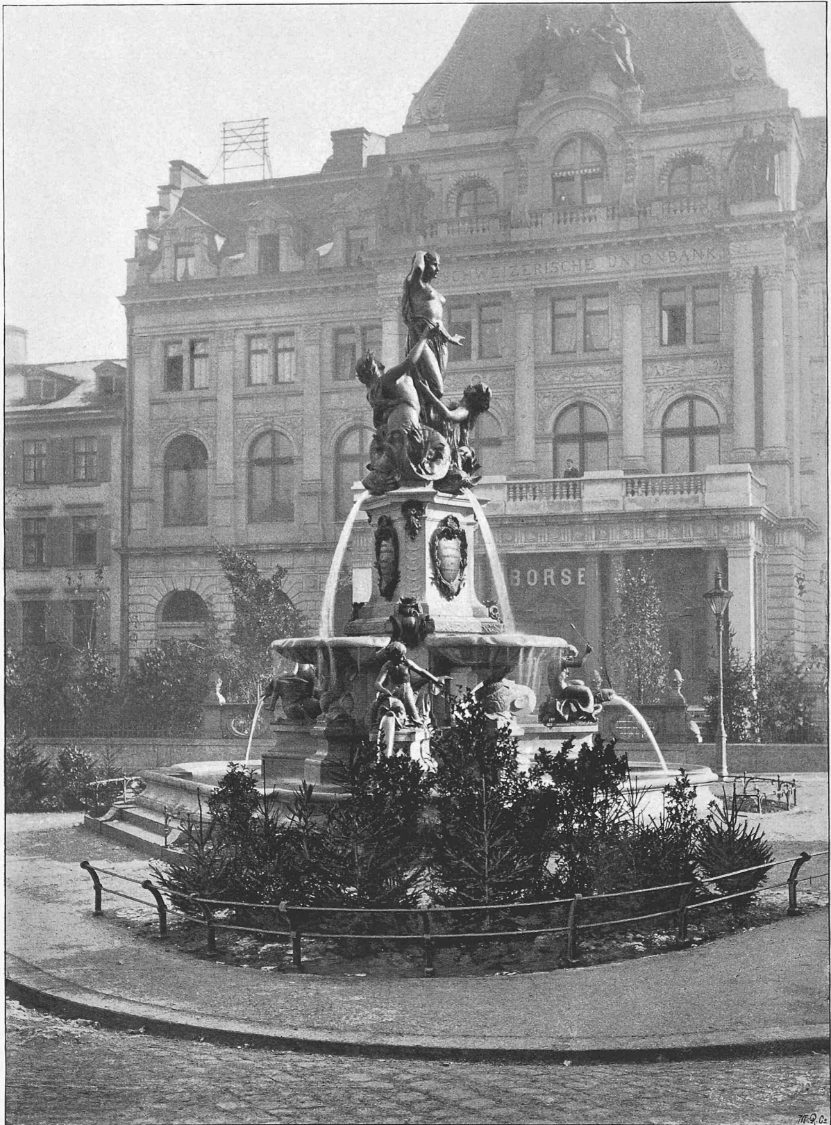
Der Broderbrunnen in St. Gallen.