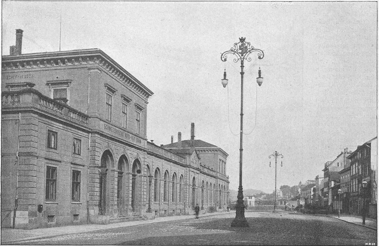
Fig. 22. Bogenlampen-Kandelaber auf dem Bahnhofplatz.