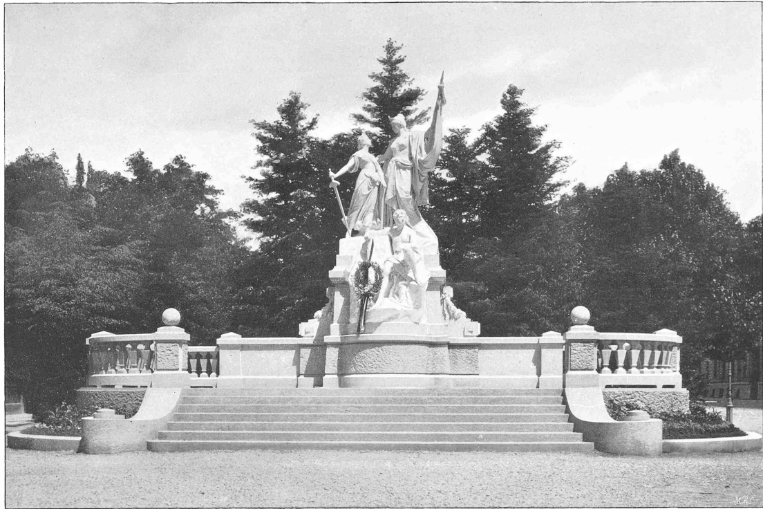
Denkmal zur Erinnerung an die Begründung der Republik Neuenburg.

Bildhauer: A. Heer und A. Meyer in Basel.