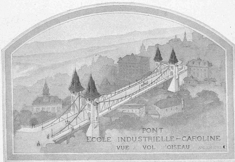
Photogr. des Originals.