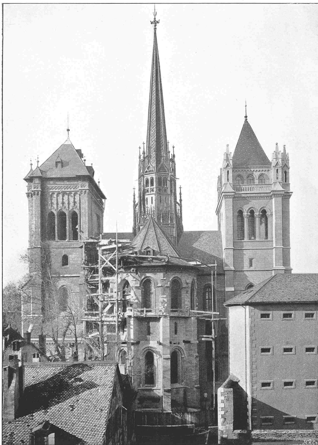
Les tours de St. Pierre de Genève.