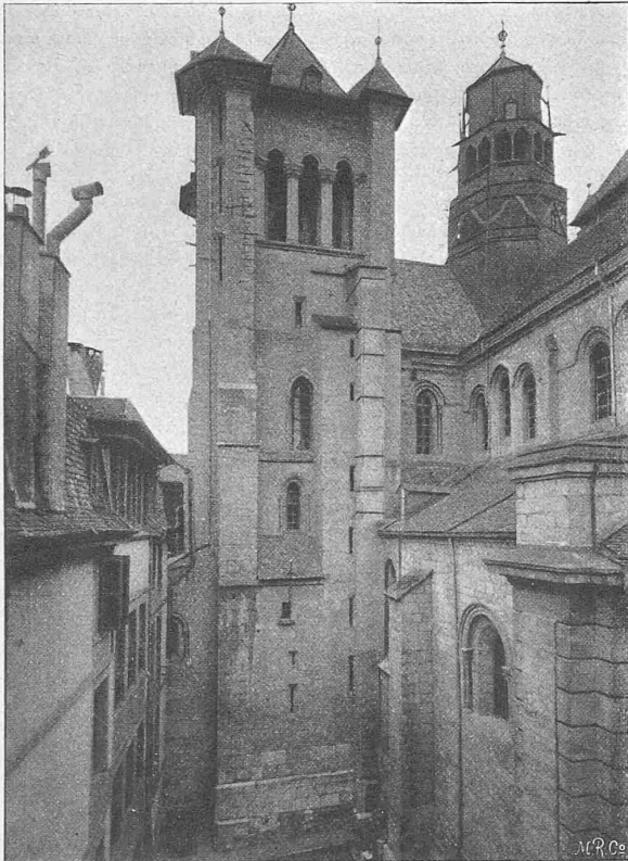
Tour du Nord; face ouest avant la restauration (1889).