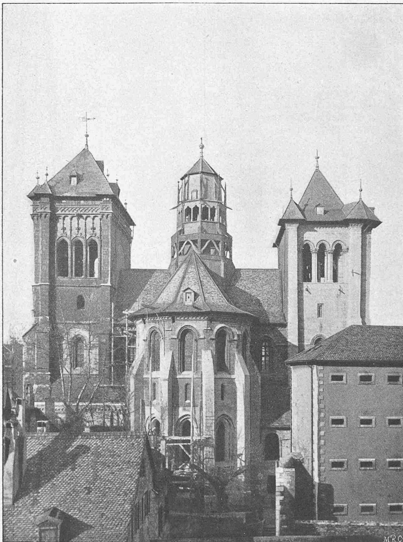
Face est, avant la restauration (1890).