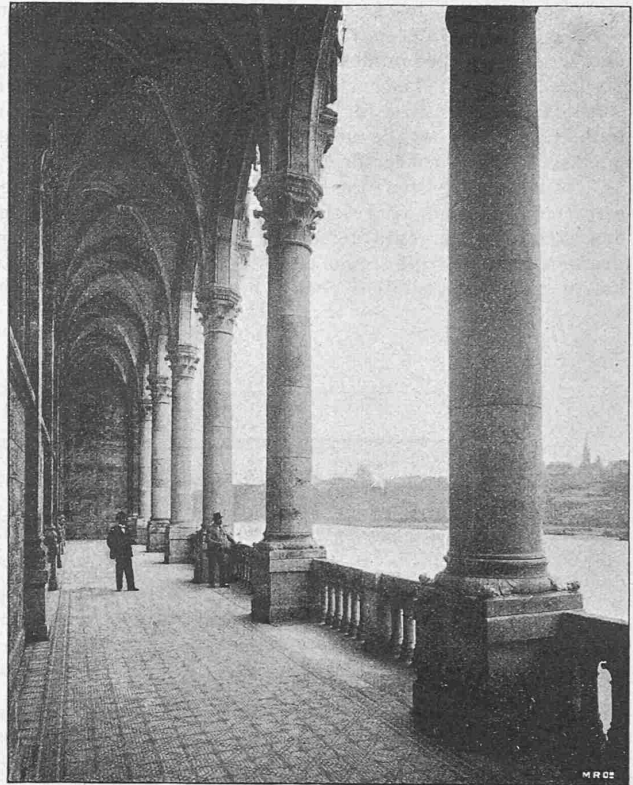
Grosse Loggia der Donauseite.

Architekt: Prof. Emerich Steindl in Budapest.