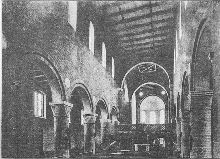
Fig. 18. Klosterkirche zu Jerichow.